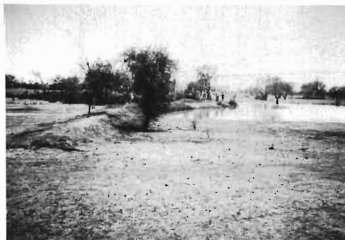
3. Petit barrage collinaire sans exutoire construit par une communauté de Ziga pour les besoins en eau des hommes et des bêtes, pour la recharge de la nappe et pour l'irrigation de petits jardins. Essais CIRAD-DSA-Ziga (Burkina Faso)