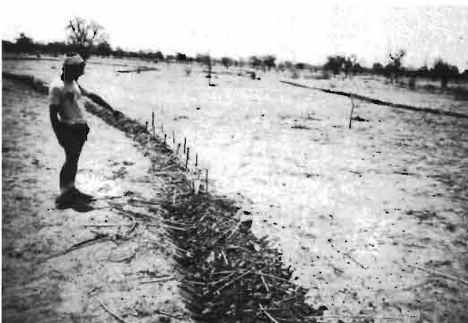
6. Diguette avec « fusible » (brèche plus ou moins colmatée par des branchages). Essais CIRAD-DSA-Ziga (Burkina Faso)