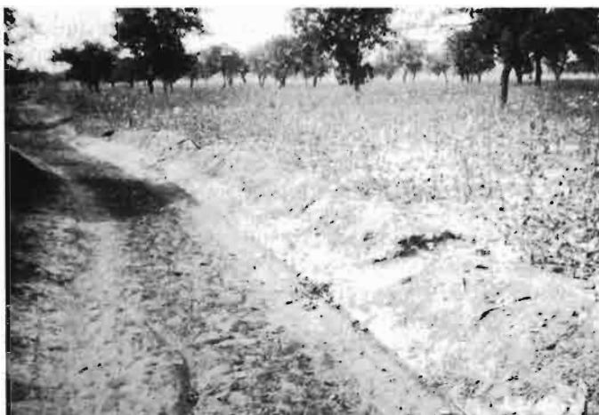
1. Exemple de digue de protection contre les eaux ruisselant des sommets gravillonnaires. Essais DRSPR — Kaniko (Sud-Mali)