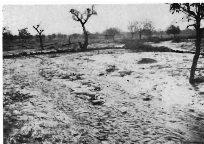
2. Zone amont d'un barrage en demi-lune destiné à capter dans une fosse périodiquement recreusée, la plus grande partie de la terre érodée et des eaux ruisselées. Ce système accroît les réserves en eau facilement exploitables. Ziga (Burkina Faso)