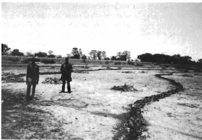
4. Cordons de pierres en pays Mossi. (Burkina Faso).