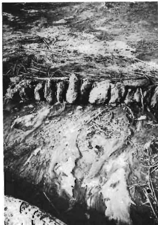
5. Détail d'un cordon de pierres à un seul niveau : En amont, dépôt de débris organiques et d'éléments minéraux grossiers. En aval, formation de griffes par effet venturi. Essais CIRAD-DSA-Ziga (Burkina Faso).