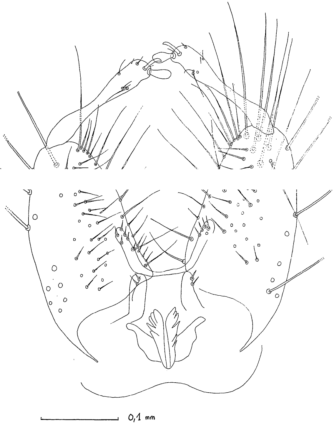
FIG. 1 — Aedes (Aedtmorphus) adami sp. n. Hypopygium de l'holotype.