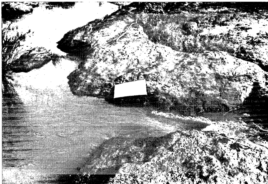
FIG. 3. — La plaque d'aluminium telle qu'elle est utilisée sur le terrain.

agressives de S. unicornutum et 89 % des femelles pondueuses sont récoltées sur les plaques situées sur les gîtes secondaires.