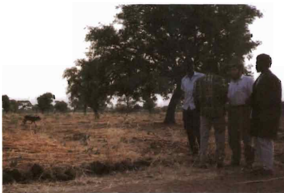
En Afrique occidentale, le paillage des sols et les cordons pierreux contribuent à la lutte anti-érosive et à une gestion communautaire des terroirs selon une approche participative expérimentée par la coopération française. en zone CMDT, Mali, janvier 1991

une initiative du Ministère Français de la Coopération, en 1978, permettant de faire émerger un nouveau réseau de chercheurs sur la question foncière.