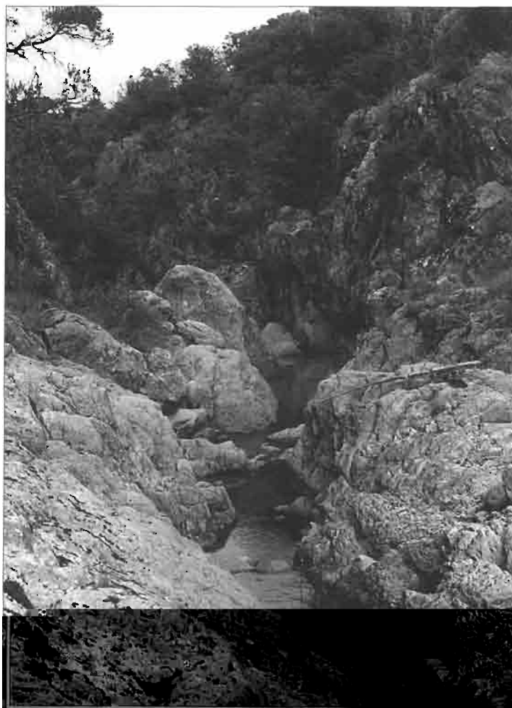
Petit ruisseau au-dessus du village de Boleras.

De nombreuses cascades permettent aux eaux abondantes (en saison des pluies) de la sierra de franchir les grands escarpements que constituent les différents affleurements rhyolithiques de la sierra. La plus connue est bien sûr celle de Basaseachic, au nord des barrancas (dans celle de Candameña) facilement accessible depuis le village du même nom, car celui-ci est situé sur la route goudronnée de Chihuahua à Hermosillo. Malgré ses 246 mètres, elle n'est pas la plus haute, puisque, proche d'elle dans le même canyon, se trouve la cascade de Pierra Volada, bien plus difficile à apercevoir, et qui n'a été découverte qu'en 1995 ; elle mesure 453 m de haut et n'atteint pas les débits de celle de Basaseachic. D'autres cascades coupent les cours des barrancas comme celles de Rukiraso et Cusárare (près de Creel) ou celle de Tonachic (près de Guachoic).