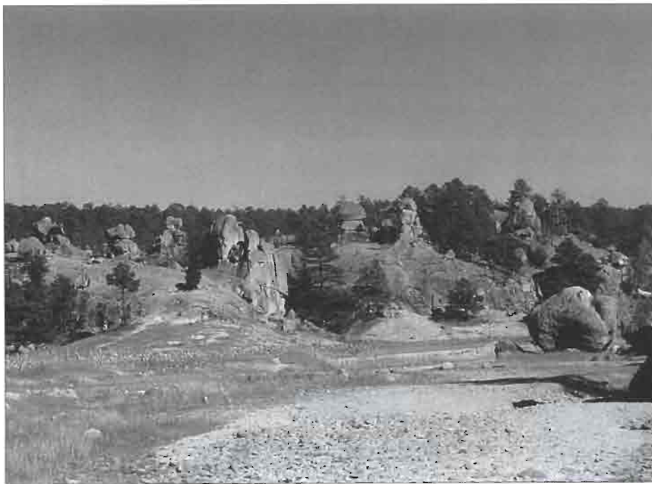
Zone de pinacles rocheux sur le plateau rhyolitique de El Salto (État de Durango).