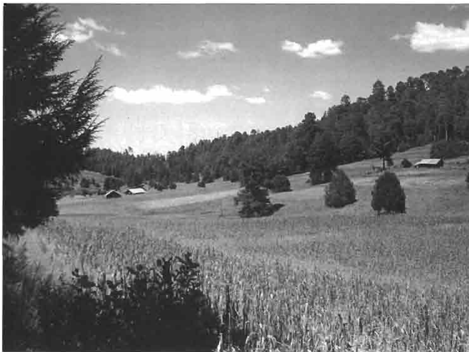
Clairière de El Tarahumar, sur la ligne de partage des eaux de la sierra.

Les sites d'intérêt touristique promis à un avenir dans ce domaine sont nombreux ; seuls les plus intéressants seront évoqués dans les pages qui suivent. C'est évidemment le point de vue d'un observateur occidental, urbain, mais cela permettra de cerner les potentialités de sites et des richesses culturelles qui pourraient servir de ciment à un renouveau d'activités touristiques et des activités induites d'hébergement, de transport, de restauration, de formation de guides, d'aménagement des sites, etc.