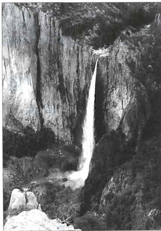
La cascade de Basaseachic.

En fait, la Sierra Madre occidentale n'est pas encore ouverte au tourisme, et de nombreux sites méritent d'être découverts, même si pour l'instant aucune infrastructure ne permet de s'y rendre ou de les visiter facilement, hormis quelques miradors et belvédères de la barranca .