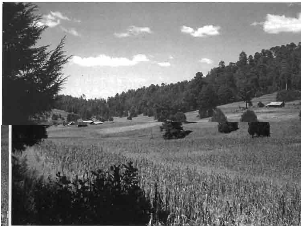
Clairière de El Tarahumar, sur la ligne de partage des eaux de la sierra.

Les sites d'intérêt touristique promis à un avenir dans ce domaine sont nombreux ; seuls les plus intéressants seront évoqués dans les pages qui suivent. C'est évidemment le point de vue d'un observateur occidental, urbain, mais cela permettra de cerner les potentialités de sites et des richesses culturelles qui pourraient servir de ciment à un renouveau d'activités touristiques et des activités induites d'hébergement, de transport, de restauration, de formation de guides, d'aménagement des sites, etc.