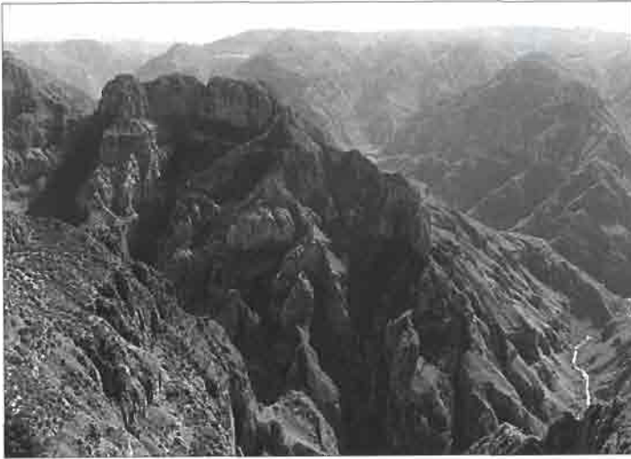
Le mirador de Los altos de Sinfrosa, près de Guachochic.