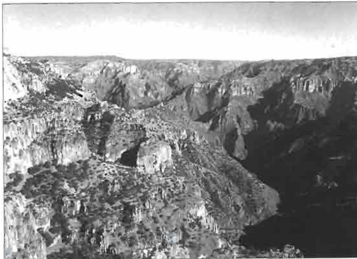
Vue de la Barranca del Cobre depuis la terrasse de la gare « Divisadero » (« point de vue » en espagnol) du chemin de fer de Chihuahua au Pacifique ; le canyon a ici 1 850 m de profondeur.

Plusieurs circuits permettent de s'enfoncer dans les gorges en différents sites, et des hôtels ou pensions ont été installés permettant de rester plus longtemps ou de visiter plus en détail certains secteurs.