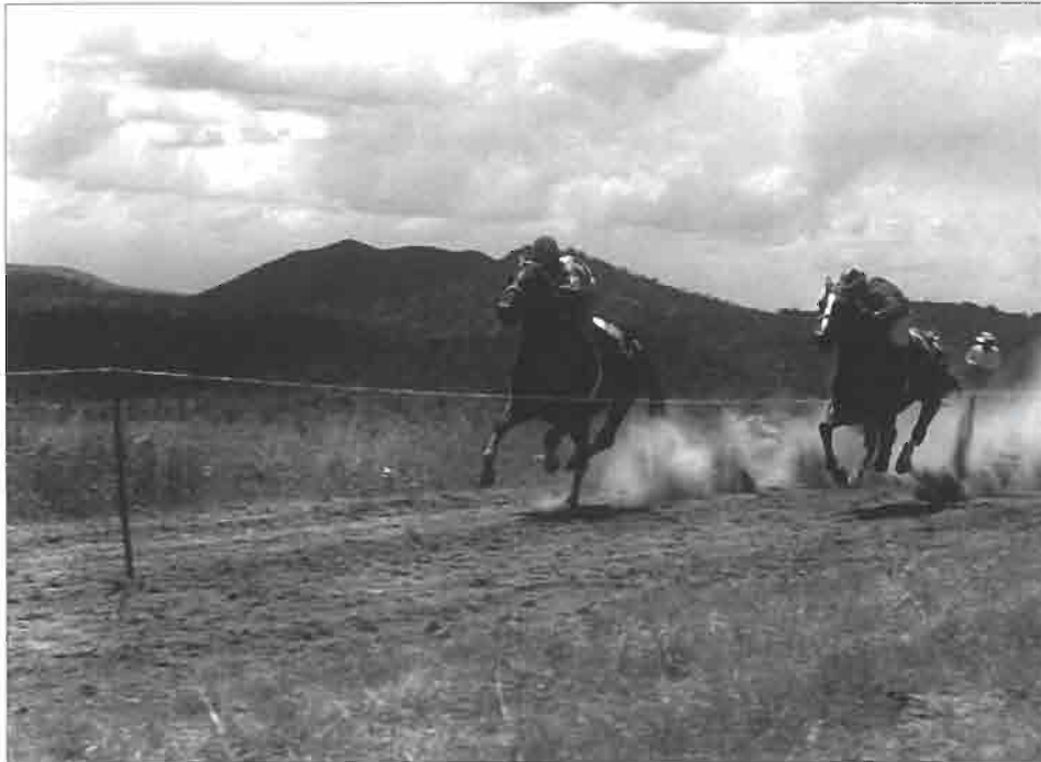
Course de chevaux au-dessus du village de Bolerias (près de Tepehuanes, État de Durango).