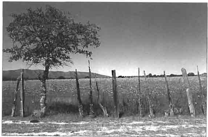
Champ de cosmos près de l'Hacienda El Ojito.

Enfin, des haciendas, dont la plupart ont été détruites ou sont tombées en ruine, ont participé à la colonisation économique de l'espace montagnard. Les plus importantes, encore une fois, se trouvent sur le piedmont oriental, où le contact montagne-hauts plateaux se prêtait bien à l'élevage bovin extensif. Ainsi dès la sortie de Durango ou de Parral, on