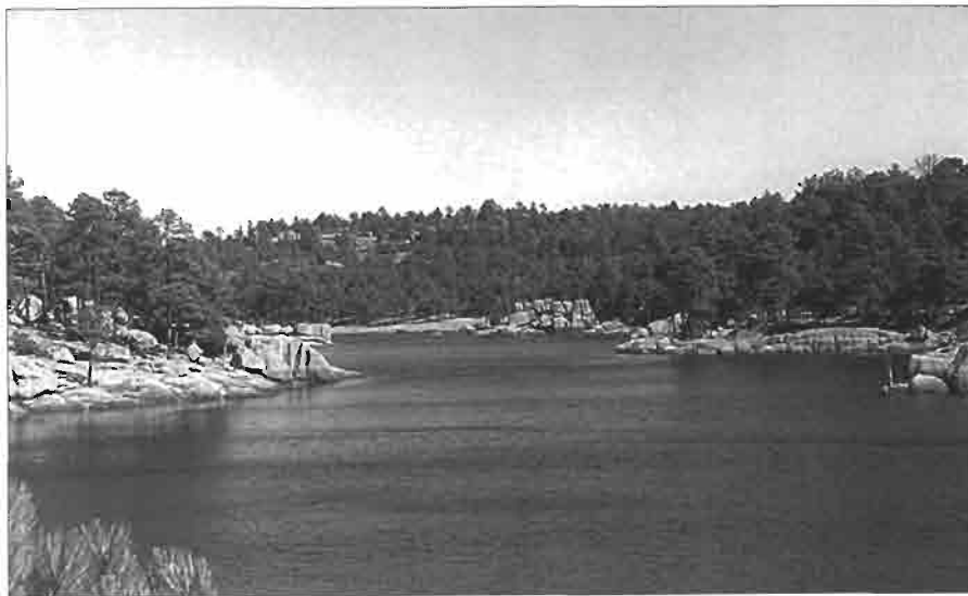
Le lac d'Arareko.

Les sources thermales sont à l'inverse nombreuses du fait de l'histoire géologique de la sierra. Des sites sont équipés pour recevoir les touristes, en particulier La Joya, près de San Francisco de Mezquital, au sud de Durango. D'autres sont aménagés pour les bains villageois, comme à El Zape ou à J.M. Morelos, entre Tepehuanes et Guanacevi (Durango) ; à côté de Durango, les habitants de cette ville peuvent profiter des sources chaudes du canyon du río Chico, qui franchit là les derniers reliefs de la Sierra Madre avant d'entrer dans la plaine. Plus au nord, la source thermique de Rekowara, dans le canyon de Tararecua, est la plus connue des Barrancas del Cobre.