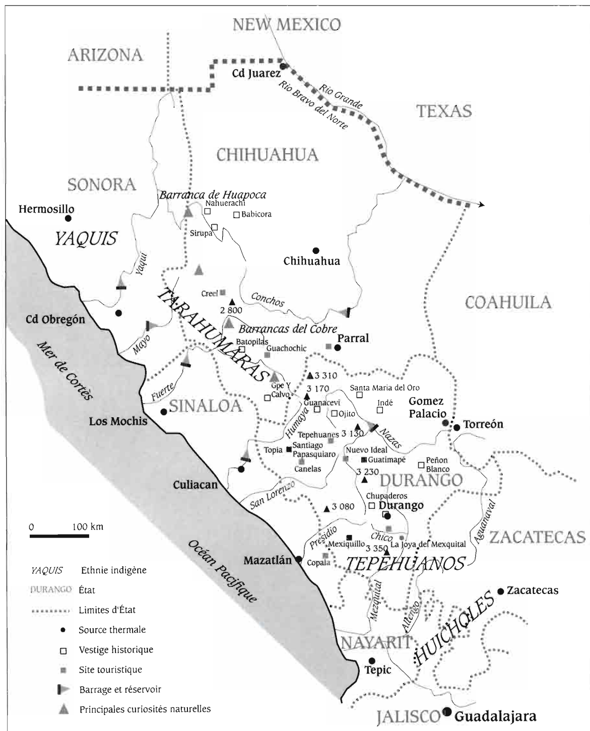
Fig. 53 – Carte de localisation des principaux points d'intérêt touristique de la Sierra Madre occidentale.