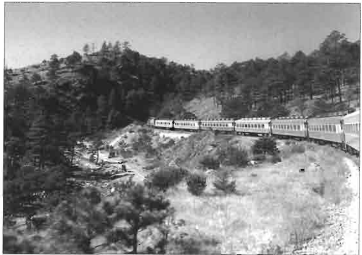
Le train de Chihuahua au Pacifique dans les Barrancas.

On appelle parfois la partie nord de la Sierra Madre (État de Chihuahua et nord du Durango) de ce nom-là, déformation de « raramuri » le vrai nom de cette ethnie dans la langue de ses membres. Le mot signifie « plante (des pieds) coureuse », ce qui sous-entend « les gens aux pieds légers ». Les Tarahumaras étaient traditionnellement installés aussi dans