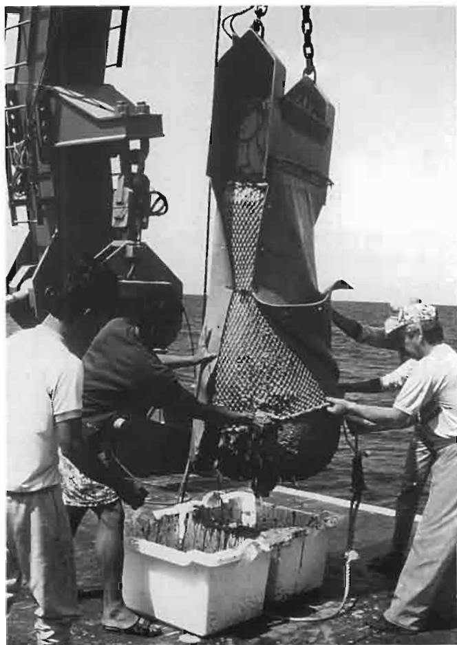
FIG. 5. — Arrivée sur le pont d'une drague Warèn pleine de vase.

d'énormes buttes de vase, notamment vers 600 m, a provoqué l'interruption du trait. Cette zone ne fournissait pas d'indices plus encourageants que la précédente en ce qui concerne les espèces commercialisables; bien entendu, comme elle s'étend à des profondeurs supérieures à la précédente, les grosses crevettes pénaïdes ( Aristeus ) y sont présentes, de même que l'énorme langoustine Metanephrops neptunus , mais pas, d'après ce que nous avons pu voir, en quantités commerciales.