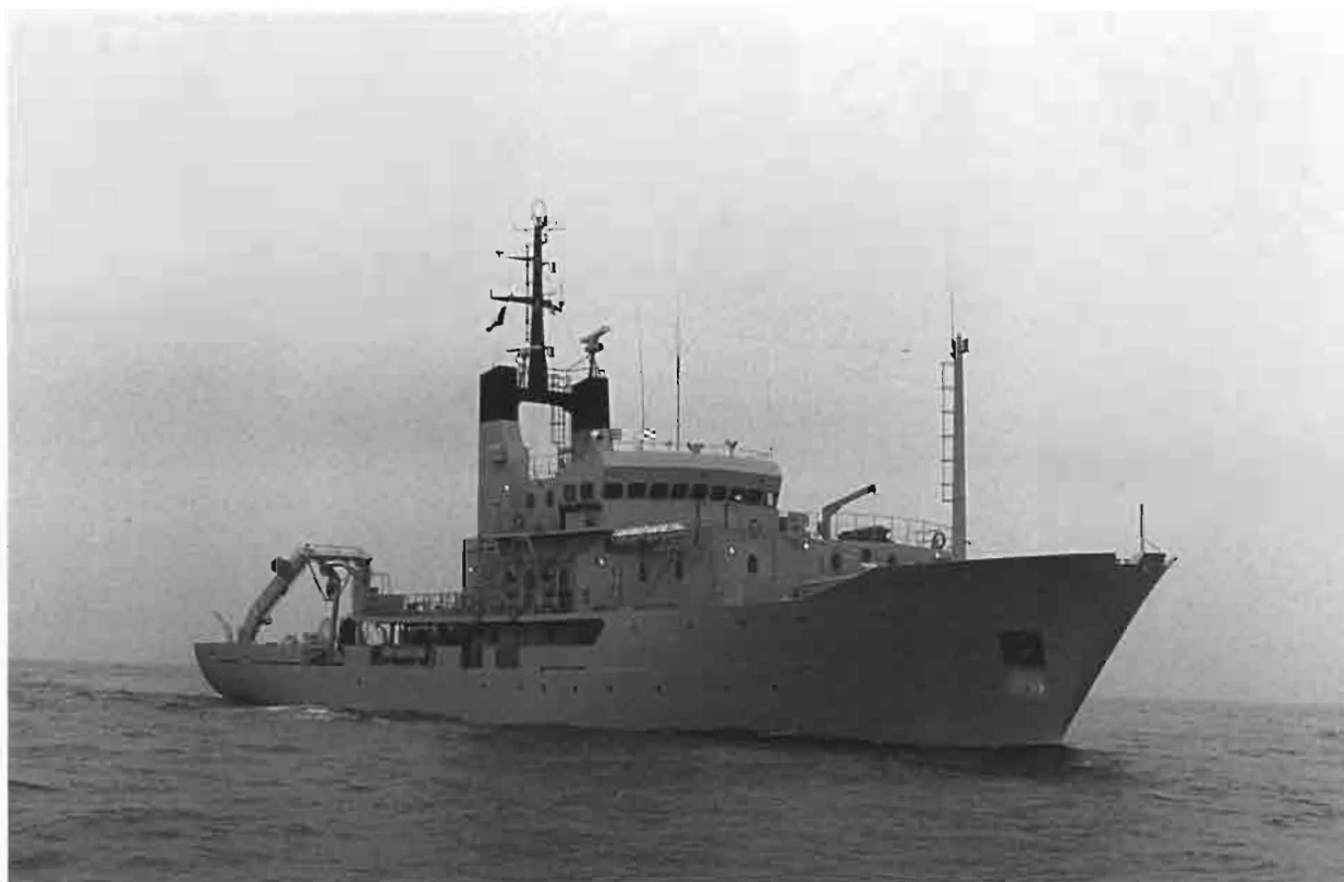
FIG. 1. — Le "Baruna Jaya I".

Philippines (BOURSEAU & ROUX, 1989). In fact, we suspect that the Kai Islands appeared so exceptional to MORTENSEN because, despite being a much-travelled marine biologist, he had only limited experience of tropical deep-sea faunal assemblages. In the eyes of a European zoologist, stalked crinoids were abyssal animals and their occurrence in shallow waters called for a special explanation. Instead, we suggest that the occurrence of stalked crinoids, as well as other markers of the deep-sea fauna, such as elasipods and echinothurids, in the 200-500 m depth interval is the norm at tropical latitudes in the Indo-Pacific. The pectinoid bivalves provide limited evidence that the shallowest occurrence of certain species is shallower in the Arafura Sea than in New Caledonia, though the opposite is true for other species. In conclusion, based on the evidence available and our own field experience in other tropical Indo-Pacific regions, we regard the Kai Islands as a rich, but not exceptional, place.