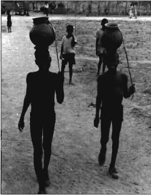
Les petits aides puisent de l'eau pour les jeunes initiés dans le canari. La corde en peau de taureau y est toujours attachée.

gens autour de lui, il leur indiqua la manière d'organiser ses funérailles : « Il faudra me mettre dans la peau de mon taureau ( rhamca ). Quand le forgeron me prendra sur ses épaules, ma femme devra saisir la queue du taureau et bien la tenir. Après, vous nous chercherez en brousse un endroit où il aura beaucoup de mouches, là vous creuserez ma tombe. » Pour les danses des funérailles, Hwempetla vola vers son tombeau, sa femme derrière lui, tenant la queue du taureau. En brousse, les gens trouvèrent l'endroit avec les mouches et ils y construisirent deux grands tombeaux.