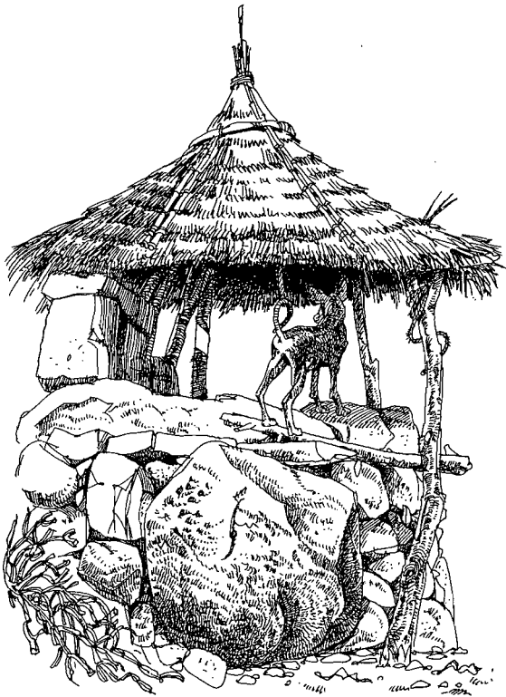
Abri de berger.

que le bovin, mais comme sous-multiple. Dans le décompte de la dot, le bovin peut apparaître comme une « super-chèvre » : en effet, théoriquement, la dot s'évalue et se règle en chèvres. Bien qu'aujourd'hui elle ait tendance à être payée en francs CFA, nombreux sont encore les règlements basés sur des chèvres ( kwi ). Un bœuf équivaut à environ dix chèvres.