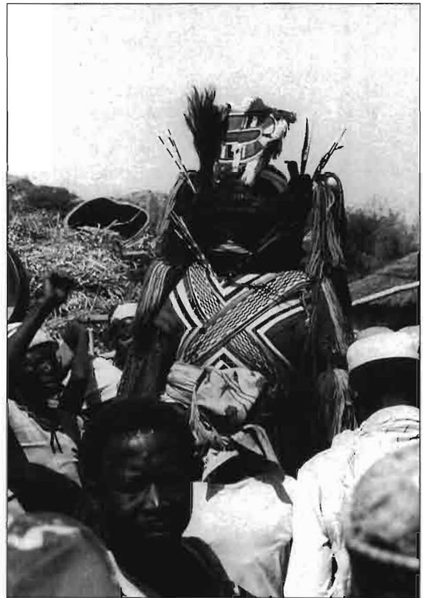
Cadavre paré, avec les queues de bœuf.

Dans le discours, le rôle du bœuf dans le monde symbolique kapsiki est peu apparent. En revanche, la symbolique du bovin fonctionne dans tous les grands rites villageois. Tous ont un rapport avec les funérailles — c'est