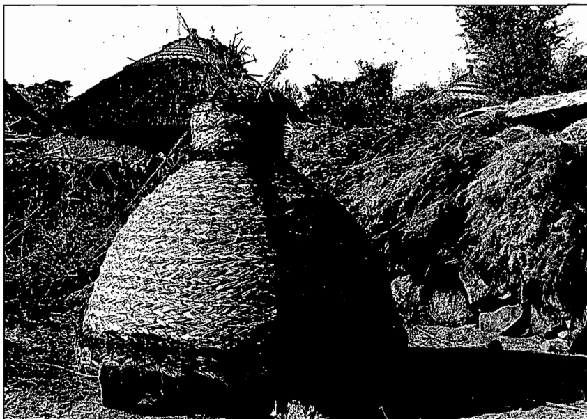
Grenier, tame , portant les marques de fumier de bœuf.

Outre le fait que les silos à grains coiffent souvent des bergeries, il existe des correspondances subtiles entre bétail et silos. Comme silo, les Kapsiki utilisent, entre autres, un grenier tressé de différentes pailles, tame (VAN BEEK, 1978; SEIGNOBOS, 1982). Aboutissement de l'art de tresser la paille, ces greniers sont l'objet de beaucoup d'attentions sociales et rituelles. Leur construction est l'occasion d'un travail en commun, arrosé par une grande quantité de bière de mil rouge, la bière cérémonielle. L'inauguration du tame traduit le lien qui existe entre céréales et bétail. Le grenier est décoré avec des bandes de fumier de bœuf, disposées autour du col et sur la base, qui sont reliées par des traits verticaux. L'officiant jette quelques petits cailloux et crottes de chèvres dans le grenier, en imitant les bruits des animaux : « meuh, meuh... méé, méé... ». Il suggère ainsi que le grenier se remplira et que le mil pourra être capitalisé en bétail, appelant la richesse sur le propriétaire.