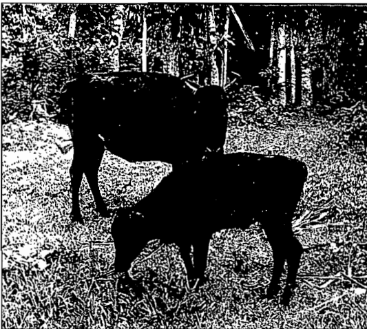
Vache taurine du Sud-Ouest suitée (variété bakwéri).

— le Muturu du Cameroun, ou Bakwéri, qui ressemble fortement au Muturu du Nigeria. Il est classé parmi les races taurines naines à courtes cornes, comme les races lagunaires.