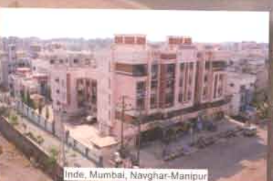
Inde, Mumbai, Navghar-Manipur