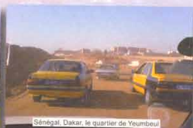
Sénégal, Dakar, le quartier de Yeumbeul