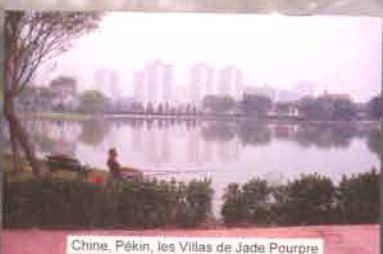
Chine, Pékin, les Villas de Jade Pourpre