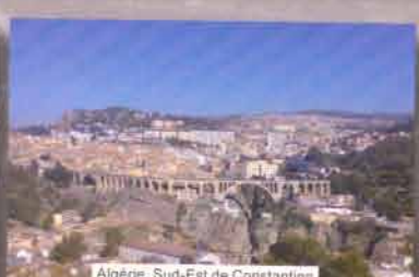
Algérie, Sud-Est de Constantine