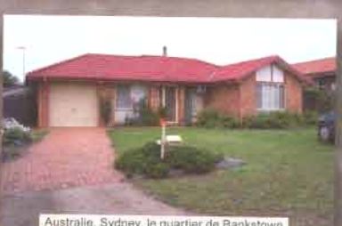
Australie, Sydney, le quartier de Bankstown