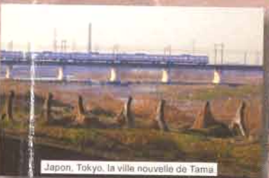
Japon, Tokyo, la ville nouvelle de Tama