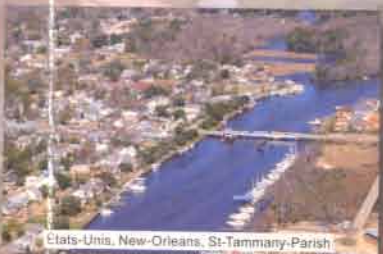
Etats-Unis, New-Orleans, St-Tammany-Parish