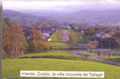
Irlande, Dublin, la ville nouvelle de Tallagh