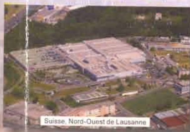
Suisse, Nord-Ouest de Lausanne