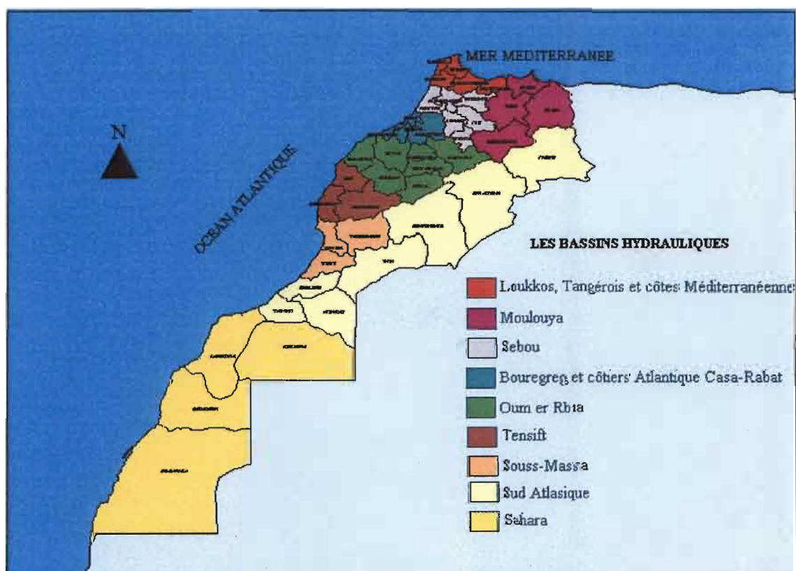
Carte 1 : Agences de bassin du Maroc

Dans un premier temps, nous avons réuni les données climatologiques que nous avons pu obtenir par accord avec notre partenaire et constitué un ensemble de jeu de cartes géo-référencées.