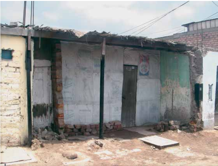
Figura 4 – Casa dañada en el barrio de Villa María del Perpetuo Socorro: la pared de la fachada, actualmente hecha de bolsas de yute, se desplomó tras el sismo de 2007