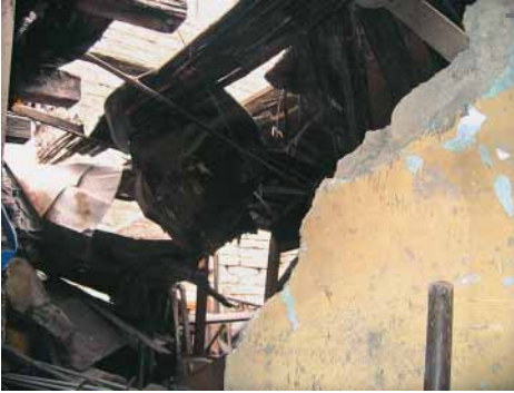
Figuras 2 y 3 – Habitante del barrio 1° de Mayo mostrando los daños en su vivienda y en particular el techo destruido. Un mes después del sismo, esta persona continuaba ocupando su vivienda durante el día. En la noche, unos vecinos la albergaban