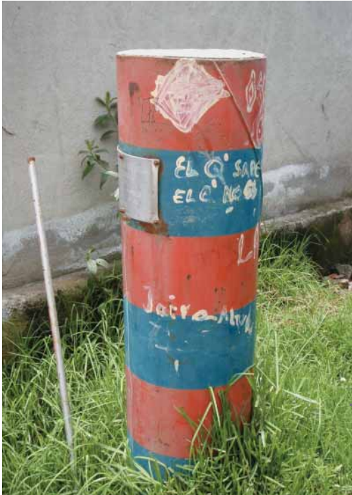
Figura 5 – Hito con los colores de la municipalidad que marca el límite legal de urbanización

de la ciudad, que indican el límite altitudinal de constructibilidad. Estos hitos se encuentran a lo largo de todas las laderas (fig. 5). Las autoridades han instalado igualmente paneles de señalización que alertan sobre los peligros que existen al instalarse más allá de este límite.