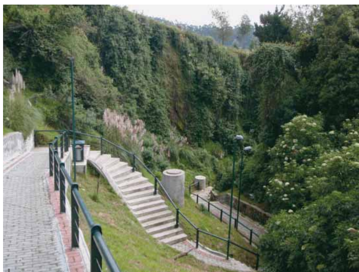
Figura 2 – Acondicionamiento del Parque El Tejar en la quebrada del mismo nombre

Esta etapa incluye igualmente obras de ingeniería civil. Así, la Emaap-Q ha instalado conexiones a lo largo de las quebradas para recoger las aguas usadas de las casas instaladas en las partes altas y evacuarlas hasta la red de saneamiento existente. El núcleo de este equipamiento parece haber sido la instalación de 7 kilómetros de colectores de evacuación de las aguas pluviales y usadas. Esta obra sirve para el buen funcionamiento de la red de saneamiento de la ciudad, pero no directamente para la lucha contra las amenazas. Al reducir la vulnerabilidad de esta red, se reduce también la vulnerabilidad del centro de Quito, pues la probabilidad