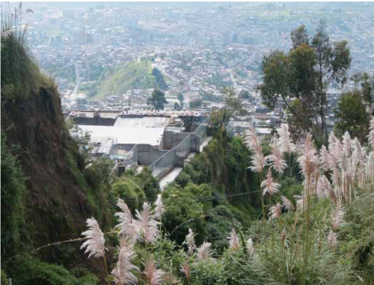
Figura 3 – Quebrada y rejas de protección

Aquí están la mayoría de las quebradas abiertas. A diferencia de las laderas noroccidentales, las partes no rellenadas son menores y más encajonadas, pues