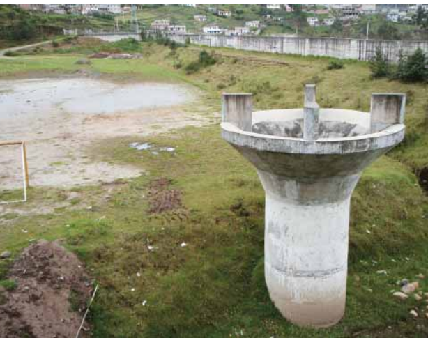
Figura 1 – Obras de protección en la quebrada Rumihurcu

El seguimiento de esta política de acondicionamiento parece haber tenido en cuenta esta visión parcial de la lucha contra el riesgo morfoclimático, al combinar respuesta de ingeniería civil y tratamiento social del espacio.