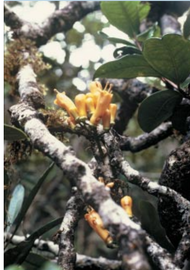
Oxera sp., plante parasite dans la forêt sommitale de la montagne des Sources, à 1 000 m d'altitude.

Plusieurs espèces de la famille des Cyatheaceae (fougères arborescentes) sont représentées dans les forêts de montagne mais une seule, Cyathea cicatricosa , serait cantonnée à ces formations orophiles. Les plus