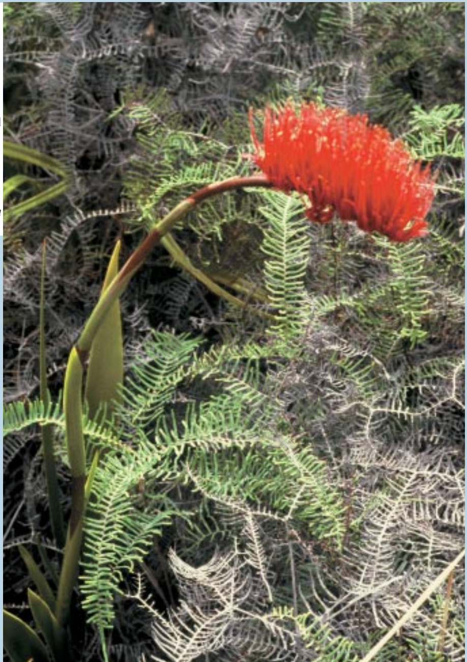
Xeronema moorei et Dicranopteris linearis (fougère) dans le maquis de la montagne des Sources, à 900 m d'altitude.

Cirad-forêt Station de Mon Caprice 7, chemin de l'IRAT Ligne Paradis 97410 Saint-Pierre-Réunion