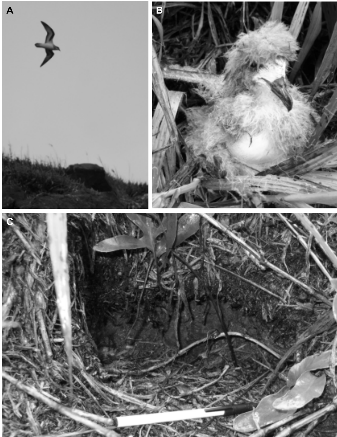
FIG. 3. - Pétrel à ailes noires ( Pterodroma nigripennis ) sur l'île Matthew (17 avril 2008). A. Individu adulte survolant sa colonie à mi-hauteur sur le flanc est du volcan principal. B. Poussin proche de l'envol, capturé au fond de son terrier dans la colonie située dans la faille du Puits, flanc est du volcan principal. C. Entrée de terrier, creusé dans la tourbe sous un tapis de fougères, flanc est ; échelle : 15 cm