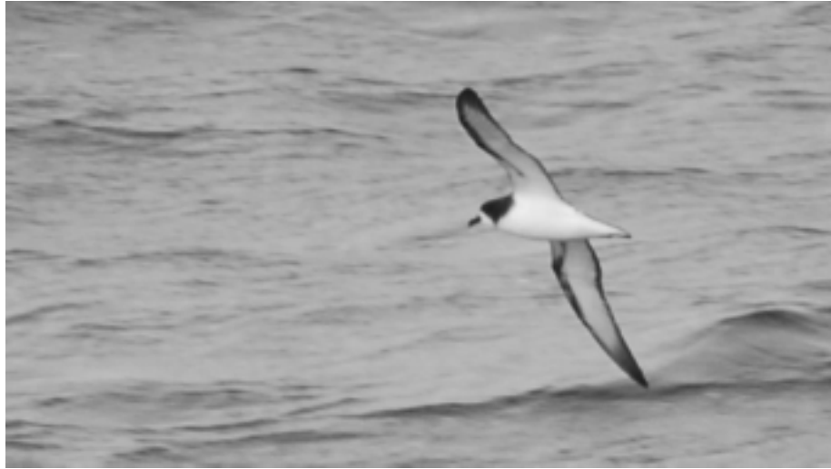
FIG. 8. - Pétrel de Gould ( Pterodroma leucoptera ) observé au large de la passe de la Havannah (22°18.7' S ; 167°15.8' E) le 16 avril 2008, 13:20