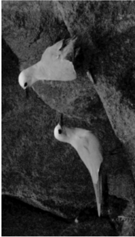
FIG. 5. - Couple de noddis gris ( Procelsterna albivitta ) au repos dans les éboulis à l'entrée du Puits, flanc est du volcan principal, île Matthew (17 avril 2008)