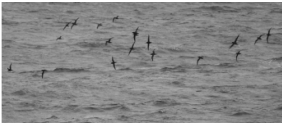
FIG. 10. - Puffins à bec grêle ( Puffinus tenuirostris ) observés en migration en direction du nord-est (22°24.3' S ; 168°08.1' E, le 16 avril 2008, 17:24)