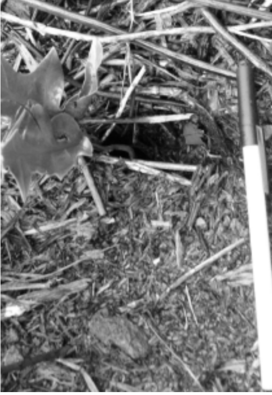
FIG. 6. - Entrée d'un terrier de petit pétrel (?), creusé dans la tourbe sous les fougères. Pentes du Puits, flanc est du volcan principal, île Matthew (17 avril 2008). Echelle : 15 cm