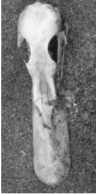
FIG. 7. - Crâne d'un cadavre d'Anatidae découvert sur l'île Matthew (17 avril 2008). Longueur, de l'extrémité du bec à l'occiput : 108 mm