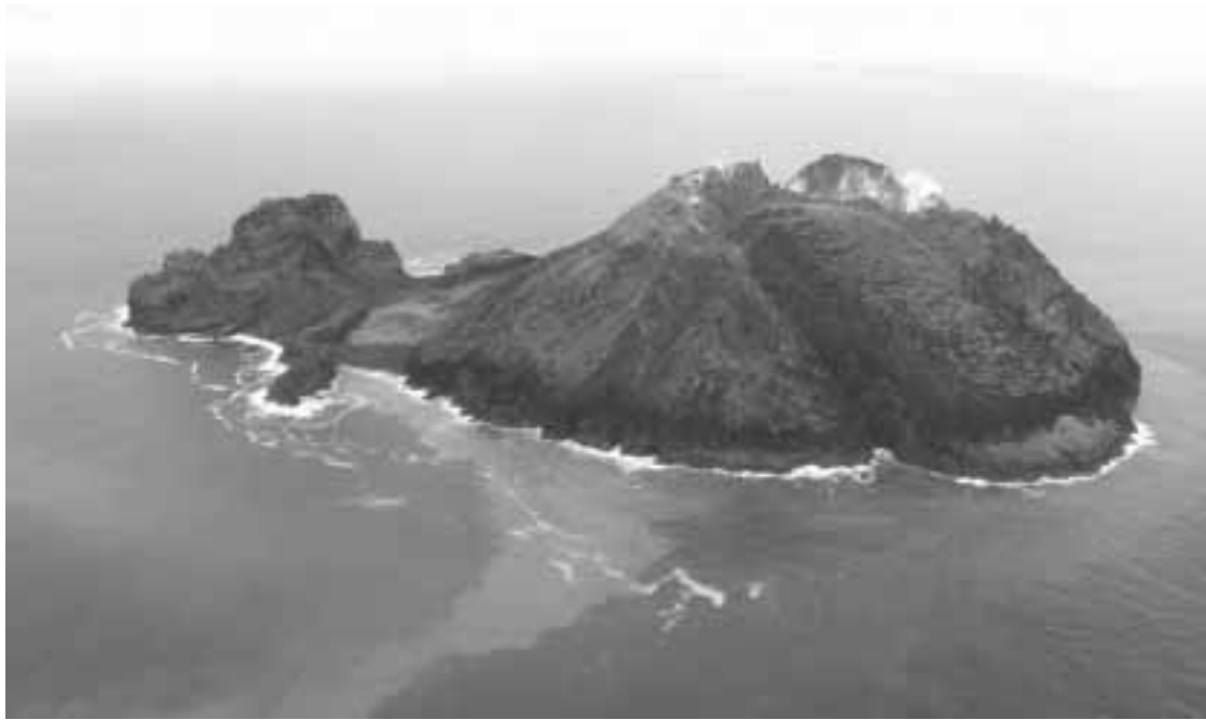
FIG. 1. - Approche de l'île Matthew par le nord, 17 avril 2008