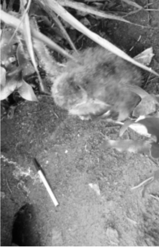
FIG. 4. - Poussin de puffin pacifique ( Puffinus pacificus ), capturé au fond de son terrier découvert sur le flanc sud-est du volcan principal, île Matthew (17 avril 2008)