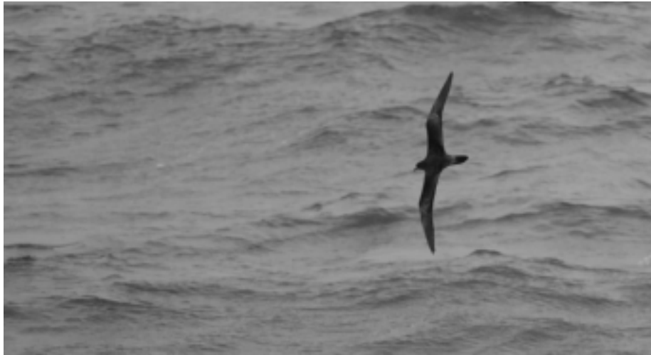
FIG. 9. - Puffin fouquet ( Puffinus pacificus ) dans le bassin des Loyauté (22°19.0' S ; 167°21.5' E) le 16 avril 2008, 13:55