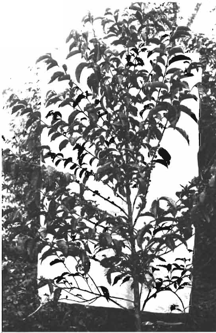
◀ Origine 11 B : Caféier à branches raides et dressées (provenance Limu)