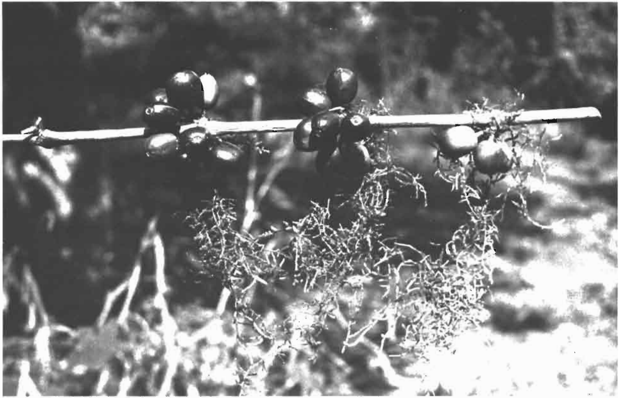
Origine 17 : Fructification abondante et synchrone d'une branche couverte de mousses épiphytes