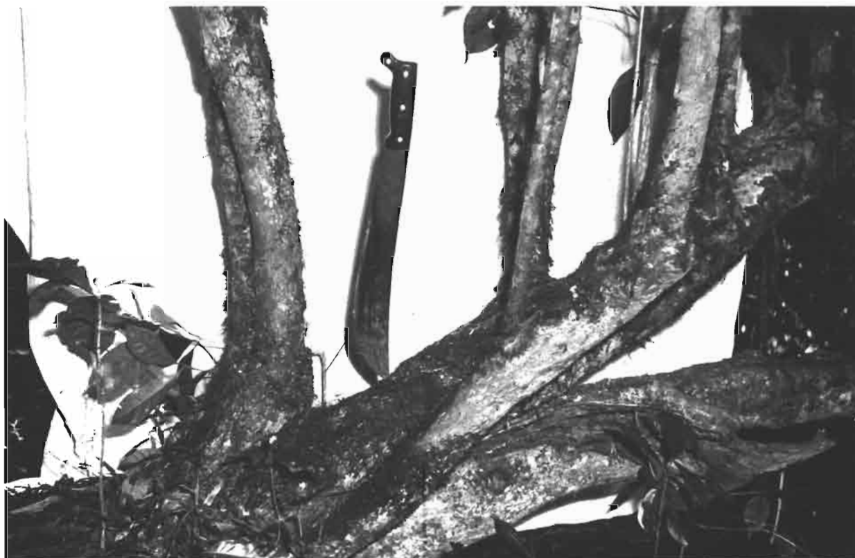
Origine 4 : Pied naturel âgé de 80 ans environ, couvert d'épiphytes, croissant en forêt de montagne dans la région de Bonga (machette de 54 cm)