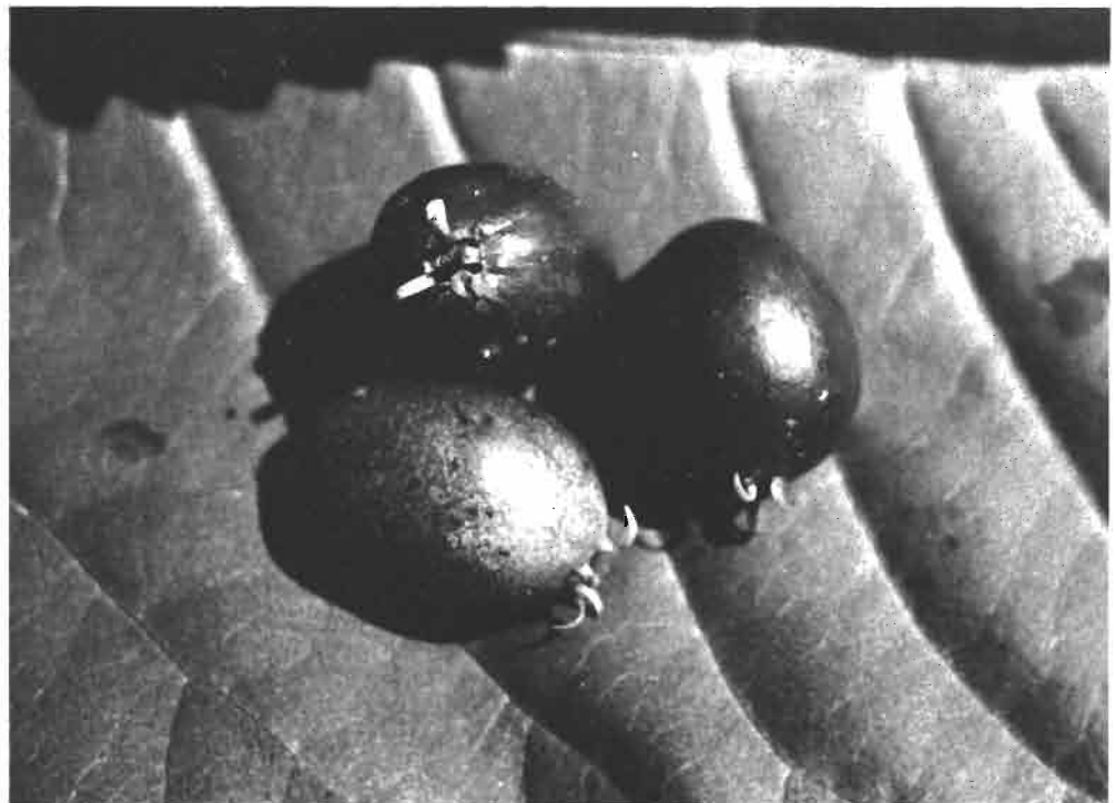
▼ Origine 19 : Caféier sauvage du nord-ouest de Goré ; fruits remarquables par la persistance des lobes du calice