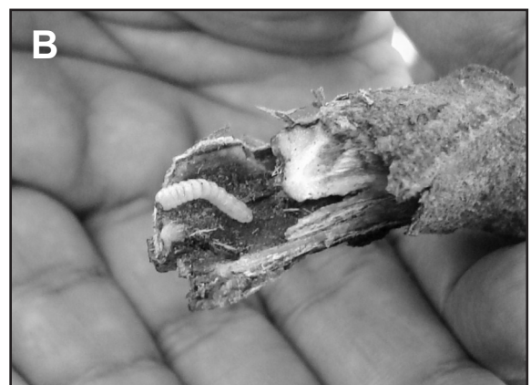
Figura 1. A) Adulto de Epicauta pestifera (Coleoptera: Meloidae), B) Larva de Alcidion deletum (Coleoptera: Cerambycidae) provocando galerías en ramas de Solanum sessiliflorum .