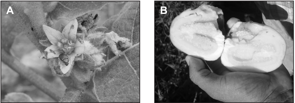
Figura 2. A) Adulto de Colaspis cf. aerea (Coleóptera: Chrysomelidae) sobre la inflorescencia de Solanum sessiliflorum ; B) Daños provocados por la larva de Neoleucinodes elegantalis (Lepidoptera: Pyralidae) sobre los frutos de Solanum sessiliflorum .