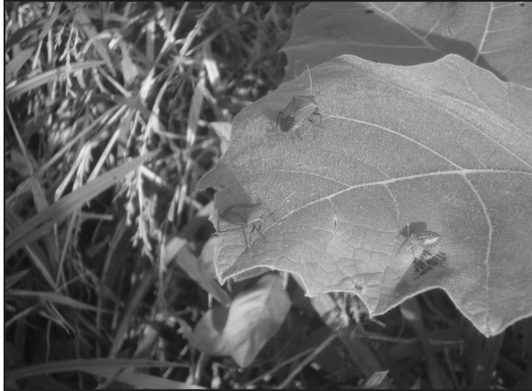
Figura 4. Adulto de Edessa rufomarginata (Hemíptera: Pentatomidae) sobre hojas de Solanum sessiliflorum .