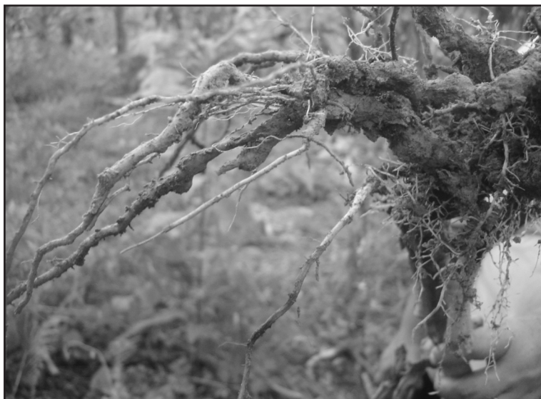
Figura 5. Daños en las raíces de Solanum sessiliflorum , provocado por el nematodo del género Melodogyne