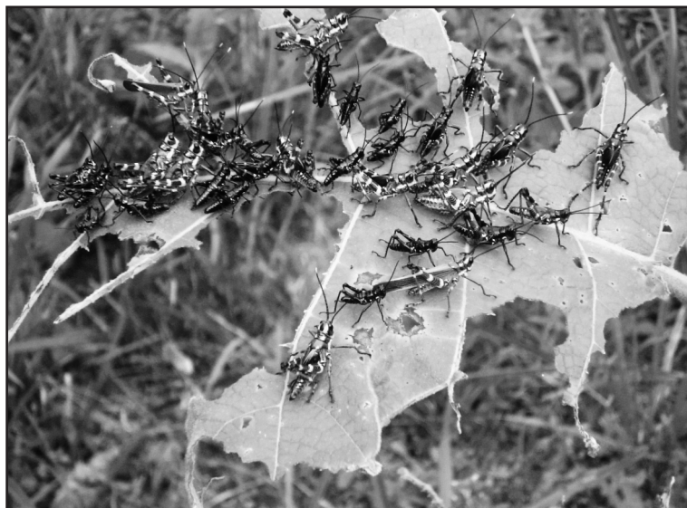
Figura 3. Colonias de Chromacris peruviana (Hortoptera: Acrididae) provocando daños en las hojas de Solanum sessiliflorum .