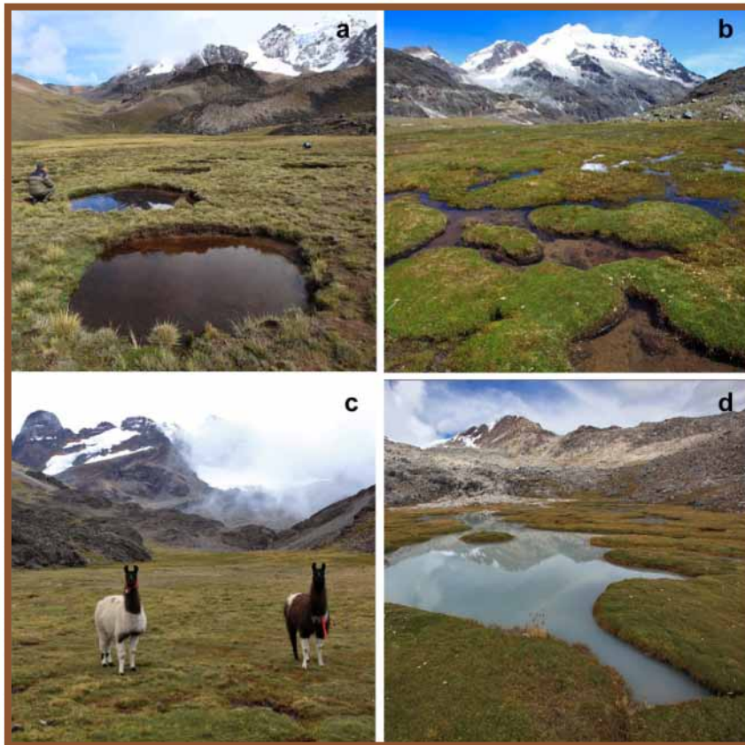
Figura 1. Paisaje de bofedales en cuatro valles de la Cordillera Real. a. Milluni, b. Huayna Potosi, c. Tuni y d. Hichu Khota.

que provee al planeta durante un año (Zedler & Kercher 2005). Además, los humedales son los ecosistemas terrestres más amenazados en el mundo, ya que han perdido a nivel mundial más del 50% de su área original (Daniels & Cumming 2008). Los humedales son unos de los sistemas más productivos del planeta (Daily 1997) y en muchos lugares del mundo permiten el desarrollo de las actividades humanas y constituyen sistemas socio-ecológicos muy complejos. En el caso de los humedales tropicales altoandinos (conocidos localmente como bofedales, ver Fig. 1), constituyen unos de los ecosistemas alpinos más diversos de las montañas en los trópicos con un elevado número de plantas