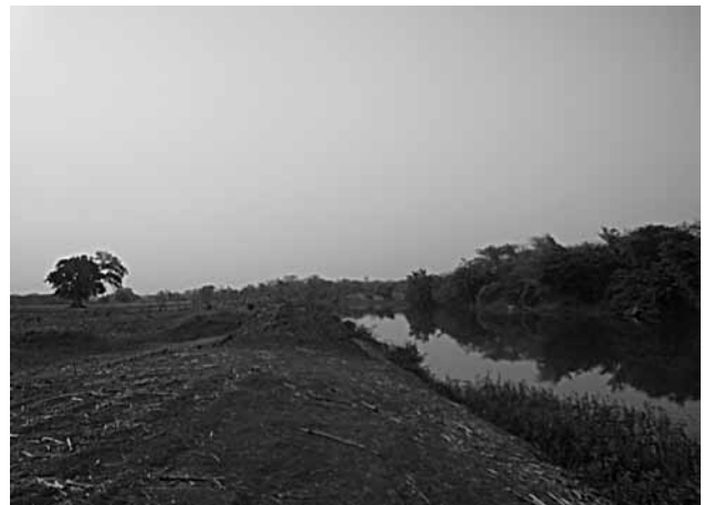
Fig. 3. – Berge cultivée du Mouhoun, la forêt-galerie de la rive gauche a totalement disparu.

Notre région d'étude s'étend sur 307 km 2 (figure 2). À l'intérieur de cette région, les terroirs des trois villages étudiés s'étendent sur une superficie de 108 km 2 et englobent une population de 1744 habitants, ce qui équivaut à une densité de population de 16 habitants/km 2 . Comme on peut le constater sur la figure 2, entre 1952 et 2007, notre zone s'est fortement anthropisée avec une augmentation de la taille des villages, du réseau de pistes et des surfaces cultivées. De 1952 à 1981 puis de 1981 à 2007, les surfaces anthropisées sont passées respectivement de 11 à 26, puis à 136 km 2 (44 % de la superficie totale), à tel point que les forêts-galeries sont touchées par le défrichement (figures 2, 3).