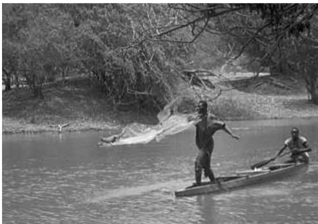
Fig. 4. – Pêcheurs Bozos pêchant à l'épervier sur le Mouhoun au niveau du village de Kassakongo.

Dans le même temps, l'évolution des pratiques migratoires des hommes a été très différente de celle des parcours des troupeaux. En fait, ce sont surtout les espaces fréquentés qui ont évolué et donc les possibilités de développement des trypanosomoses. Depuis la crise sociopolitique de 2002 en Côte-d'Ivoire, les jeunes burkinabè sont de plus en plus nombreux à délaisser "l'eldorado ivoirien" au profit des fronts pionniers burkinabè situés dans le sud-ouest où ils partent cultiver le coton et l'anacarde. Il faut aussi admettre que les prévalences de THA en Côte-d'Ivoire sont nettement moins importantes aujourd'hui que dans les années 1940. Il est donc moins probable qu'un jeune burkinabè partant travailler en Côte-d'Ivoire ne revienne avec le parasite (Courtin et al. , 2008). Contrairement