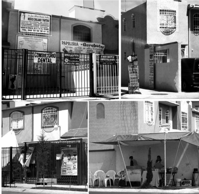
De gauche à droite, de haut en bas : Services à l'intérieur du logement. Annonces de commerces dans une rue fermée. Rez-de-chaussée transformé en épicerie. Commerce dans l'espace public.