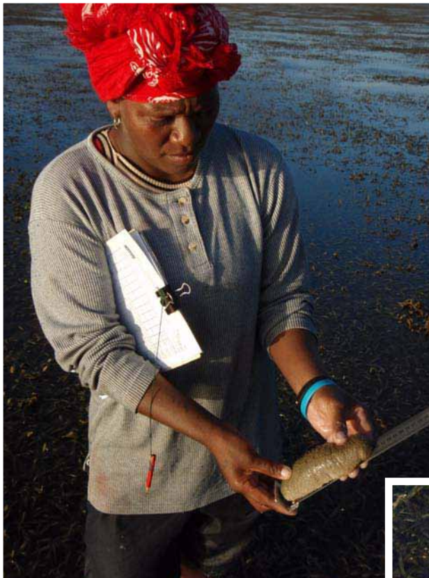
Les comptages des bêtes-de-mer se font à pied le long de couloirs de 100 m de long sur 2 m de large. Deux personnes mesurent la longueur et la largeur des individus, ce qui permettra de calculer leur poids. Les pêcheurs participent à ces opérations.