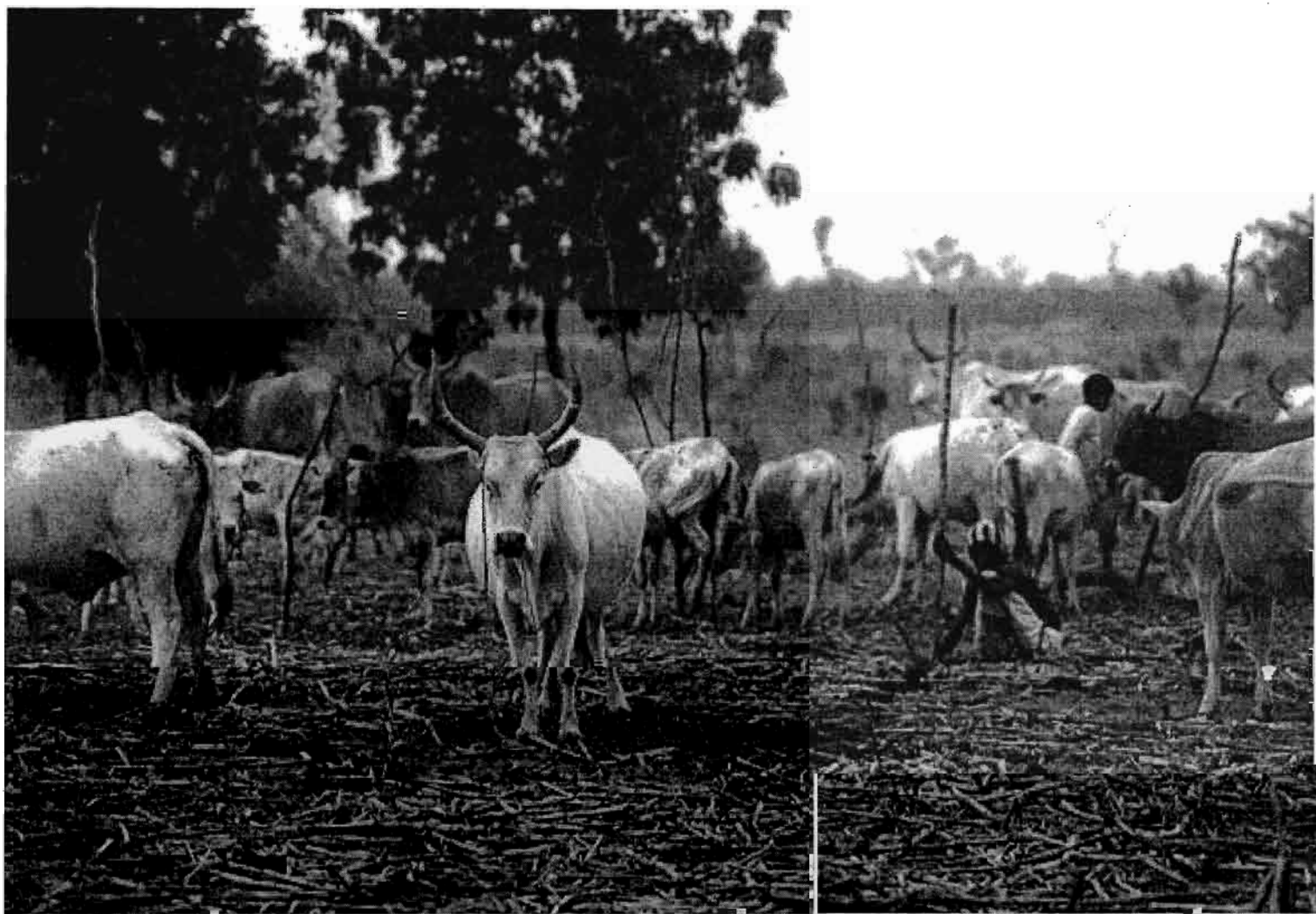
Troupeau de bovins au piquet sur litière de mil : poudrette de parc imprégnée d'urines