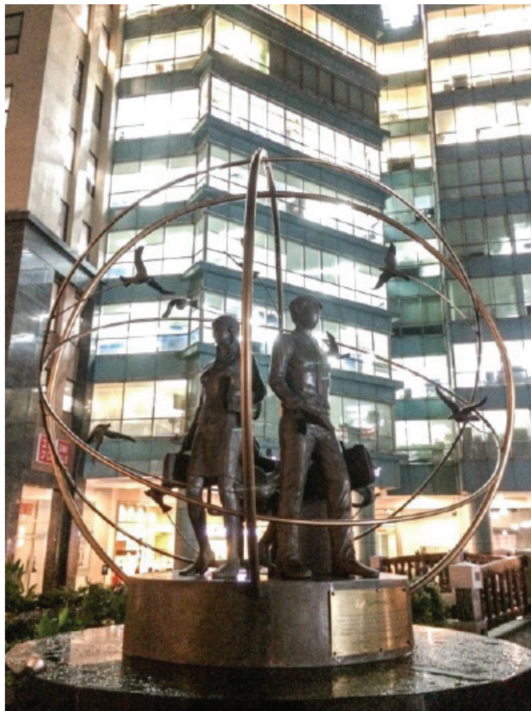
Monuments aux agents de centres d'appels, 31 juillet 2014, 23 heures 7