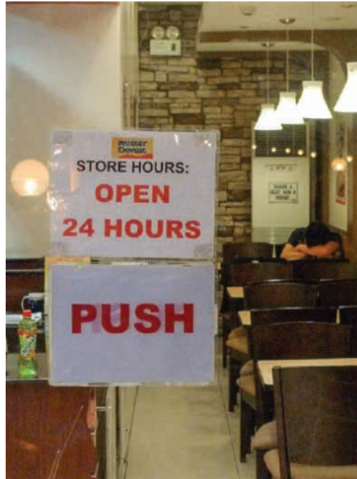
Travail de nuit et fatigue

Mais le stigmate de la nuit transparait aussi dans les multiples images associées à ces travailleurs. Si les entreprises cherchent à les dépeindre comme des gens dynamiques, internationalisés et à l'écoute des autres, les discours sociaux et médiatiques disent tout autre chose. Les centres de contact sont vus comme des usines à la chaîne, des sweatshops des temps modernes 15 où, si l'on a de bons salaires, on a peu de droits. Les rythmes et la productivité y sont étroitement contrôlés et surveillés : on vérifie aussi bien le nombre d'appels passés, leur durée que leur succès ou leur échec et leur « qualité ».