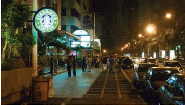
Emerald Street, Ortigas, 6 octobre 2010, 22 heures

les risques liés aux catastrophes naturelles (tremblements de terre, typhons et inondations) qui pourraient empêcher l'activité de fonctionner en permanence. Ce sont des zones qui sont dissociées du reste de l'agglomération et des quartiers noctambules (même si l'on trouve de très rares intersections à Makati, ou à Ortigas et Araneta par exemple), mais aussi déconnectées par les heures d'opération, la lumière et les décalages entre façons de faire états-unienne et philippines : les employés y sont Américains la nuit et Philippins le jour.