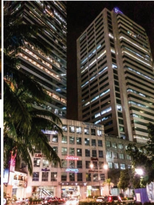
Eastwood City, 31 juillet 2014, 22 heures