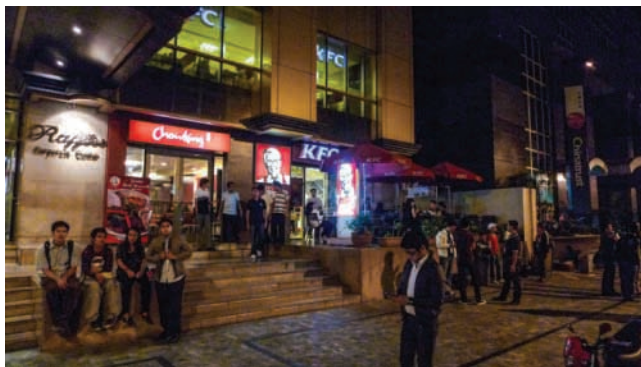
Emerald Street, Ortigas, 6 octobre 2010, 22h50