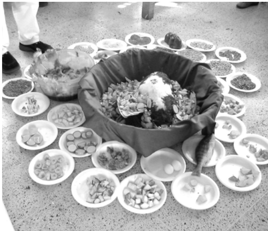
Ofrendas para Olokun, Puerto de Veracruz, 2005.

percusionistas y bailarinas provenientes de la zona universitaria y capital del Estado: Xalapa. Ellos se beneficiaron desde finales de los 80 de la enseñanza de artistas negroamericanos implicados en la militancia afrocentrista, los cuales fomentaron su interés por el repertorio musical y coreográfico afrocubano. Estos artistas xalapeños iniciaron, con el apoyo del Área de Artes de la Universidad Veracruzana, programas de intercambios regulares entre Cuba y México que proponían cursos y talleres con maestros cubanos de renombre. Mediante estas iniciativas, se insertaron en la red transnacional de artistas intérpretes del repertorio afrocubano y se convirtieron, entre otras cosas, en espe-