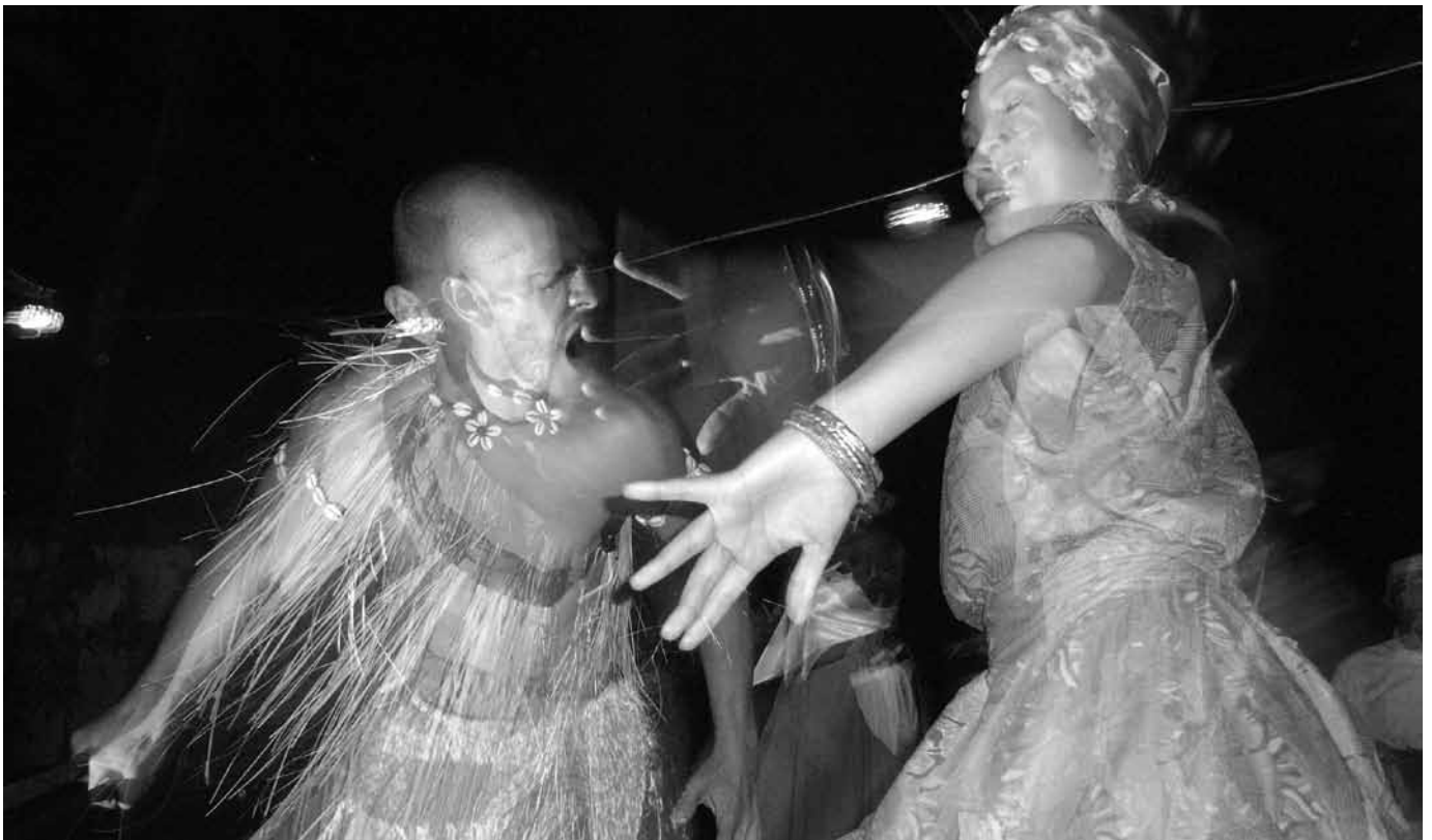
Espectáculo Afromestizo , día de brujos, Nanciyaga, Veracruz, 2008.

Dado este contexto, los santeros del puerto que enfatizan la africanidad de la santería, o los que intentan transformarla en elemento de identidad local resultan muy minoritarios. En este caso, es la variable “cultura” la que se moviliza de manera prioritaria, y que permite contrarrestar las acusaciones de satanismo. Pero aún así, la lucha queda desigual. La predominancia del cristianismo confina localmente la santería, junto con el grupo de prácticas con las que es asociada (culto a los santos y culto marial, curanderismo, brujería, espiritismo, chamanismo, culto a la Santa Muerte, culto a los ángeles, prácticas neo-esotéricas diversas), a un espacio restringido de legitimidad: el mercado de los servicios mágico-religiosos.