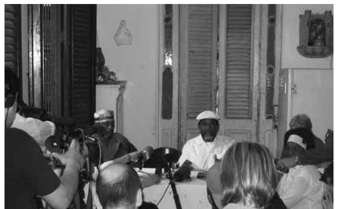
Letra del año, La Habana, 1º de enero 2006. Conferencia de prensa.