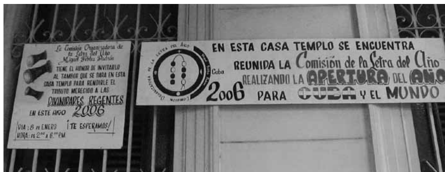
Letra del año, La Habana, 2006. Cartel (detalle).

De igual manera corresponden los resultados que subrayan la imposibilidad de relacionar, en la sociedad cubana contemporánea, un tipo de expresión religiosa con una clase social (ídem: 89) o con categorías raciales (ídem: 98; López Valdés, 1985: 223) subjetivas por definición: “los grupos carecen de fronteras claramente definidas: son comunes los casos de identificación controvertida, a partir del rico abanico de variantes fenotípicas que se dan como resultado del mestizaje, que permite fácilmente “saltar” la barrera del color. La propia nomenclatura popular de los fenotipos no es excluyente, y responde a la apreciación personal del individuo, según el color de la piel de cada espectador, y la influencia del medio circundante: los que para unos -en un determinado contexto- pueden ser blancos o negros, para otros -en otro contexto- resultan ser mestizos o a la inversa” (Buscarón, Núñez y Rodríguez, 2006).