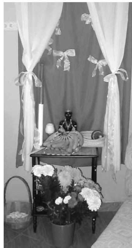
Altar con bulto de “Changó macho”, sin fundamento. Puerto de Veracruz, 2005.

El caso de Veracruz resulta muy interesante porque los santeros veracruzanos, que son poco numerosos pero sobre todo muy discretos, se encuentran, de alguna manera, en una posición de “fin de línea” dentro de la red transnacional de practicantes de la religión de los orisha. Ellos desconocen, desde luego, la actualidad del movimiento “tradicionalista” (los congresos mundiales, las principales polémicas) y no utilizan de manera frecuente las oportunidades que ofrece Internet para mantenerse informados sobre el mismo. Dicha posición resulta en parte de un