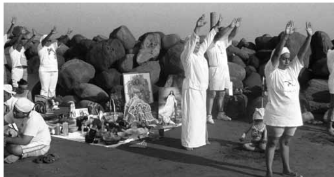
Ritual al mar para Yemayá, puerto de Veracruz, 1º de noviembre 2006.