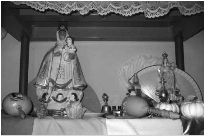
Canastillero sin fundamentos, puerto de Veracruz, 2005.