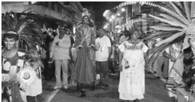
Procesión del grupo Blanca Flor, puerto de Veracruz, 1º de noviembre 2008.