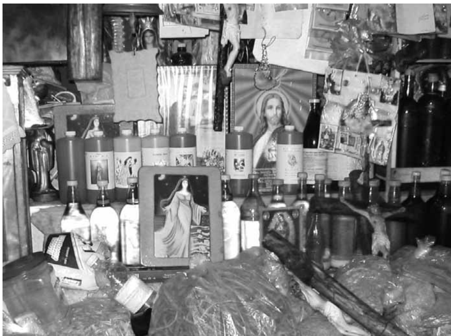
Imagen de Yemayá en el mercado Hidalgo, puerto de Veracruz, 2005.

En cambio, los diversos especialistas locales utilizan de manera cotidiana los productos manufacturados de evocación santera en sus rituales de curación. Efectivamente, es bien conocida la dimensión simbólica que se emplea en este caso,