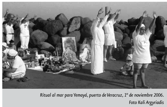
Ritual al mar para Yemayá, puerto de Veracruz, 1º de noviembre 2006.