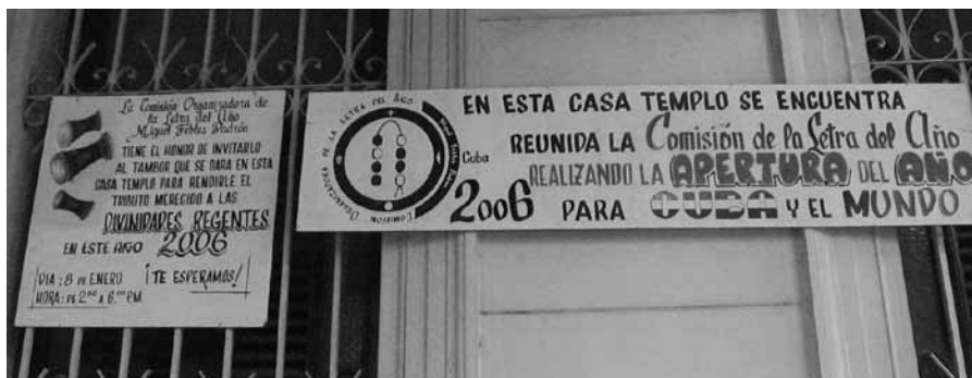
Letra del año, La Habana, 2006. Cartel (detalle).

De igual manera corresponden los resultados que subrayan la imposibilidad de relacionar, en la sociedad cubana contemporánea, un tipo de expresión religiosa con una clase social (ídem: 89) o con categorías raciales (ídem: 98; López Valdés, 1985: 223) subjetivas por definición: "los grupos carecen de fronteras claramente definidas: son comunes los casos de identificación controvertida, a partir del rico abanico de variantes fenotípicas que se dan como resultado del mestizaje, que permite fácilmente "saltar" la barrera del color. La propia nomenclatura popular de los fenotipos no es excluyente, y responde a la apreciación personal del individuo, según el color de la piel de cada espectador, y la influencia del medio circundante: los que para unos -en un determinado contexto- pueden ser blancos o negros, para otros -en otro contexto- resultan ser mestizos o a la inversa" (Buscarón, Núñez y Rodríguez, 2006).