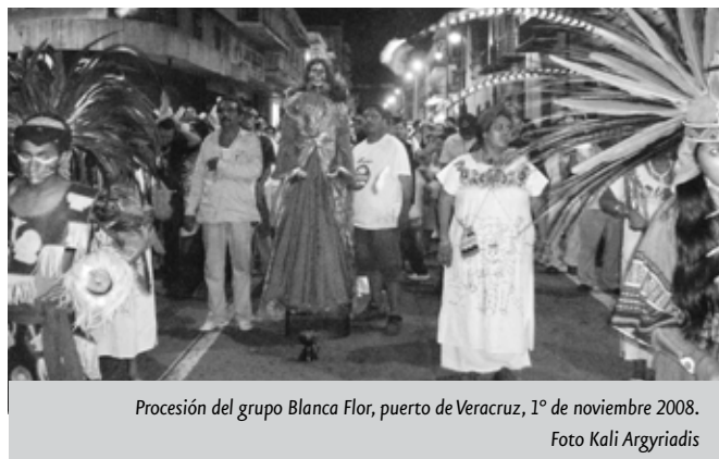
Procesión del grupo Blanca Flor, puerto de Veracruz, 1º de noviembre 2008.

Mediante la expresión de estas rivalidades, se ve de qué manera, igual que en el caso del espiritismo kardecista en el siglo pasado o de ciertas prácticas New Age actuales cuyo vocabulario metacientífico es muy utilizado en Veracruz tanto por los santeros como por los demás ritualistas diversos (vibraciones, energías, operaciones invisibles, medicina holística...), la santería goza actualmente de un estatus de práctica de “gente estudiada”, prestigio conferido por un lado por la referencia a su cubanidad, y por el otro lado por la presencia reiterada de su repertorio musical y coreográfico en todos los eventos culturales locales importantes. Pero a su vez, dicha cubanidad, en la versión más africana y negativa del estereotipo, es utilizada de manera ambivalente como práctica de “brujería fuerte”, salvaje y por ende muy potente, alimentada por el recuerdo de los atemorizantes sacrificios de animales puestos en escena en los foros Ritos, magia y hechicería del Festival Internacional Afrocaribeño.