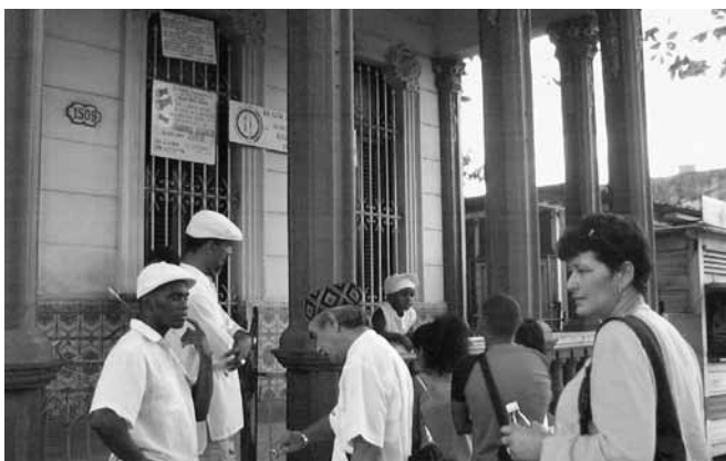
Letra del año, La Habana, 2006. Predicciones de los babaños de la comisión Miguel Febles para Cuba y el mundo.

Los intercambios ideológicos y artísticos transatlánticos de los años 20, junto con el rechazo paralelo al modelo dominante