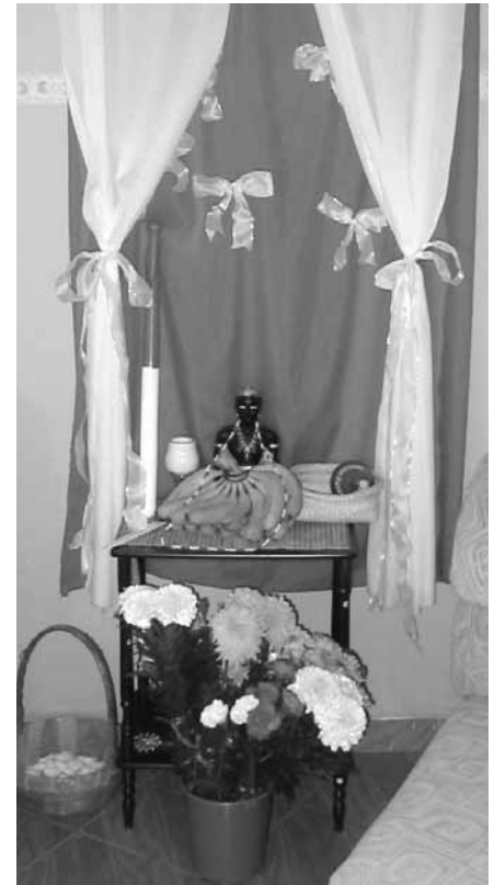
Altar con bulto de “Changó macho”, sin fundamento. Puerto de Veracruz, 2005.

El caso de Veracruz resulta muy interesante porque los santeros veracruzanos, que son poco numerosos pero sobre todo muy discretos, se encuentran, de alguna manera, en una posición de “fin de línea” dentro de la red transnacional de practicantes de la religión de los orisha. Ellos desconocen, desde luego, la actualidad del movimiento “tradicionalista” (los congresos mundiales, las principales polémicas) y no utilizan de manera frecuente las oportunidades que ofrece Internet para mantenerse informados sobre el mismo. Dicha posición resulta en parte de un