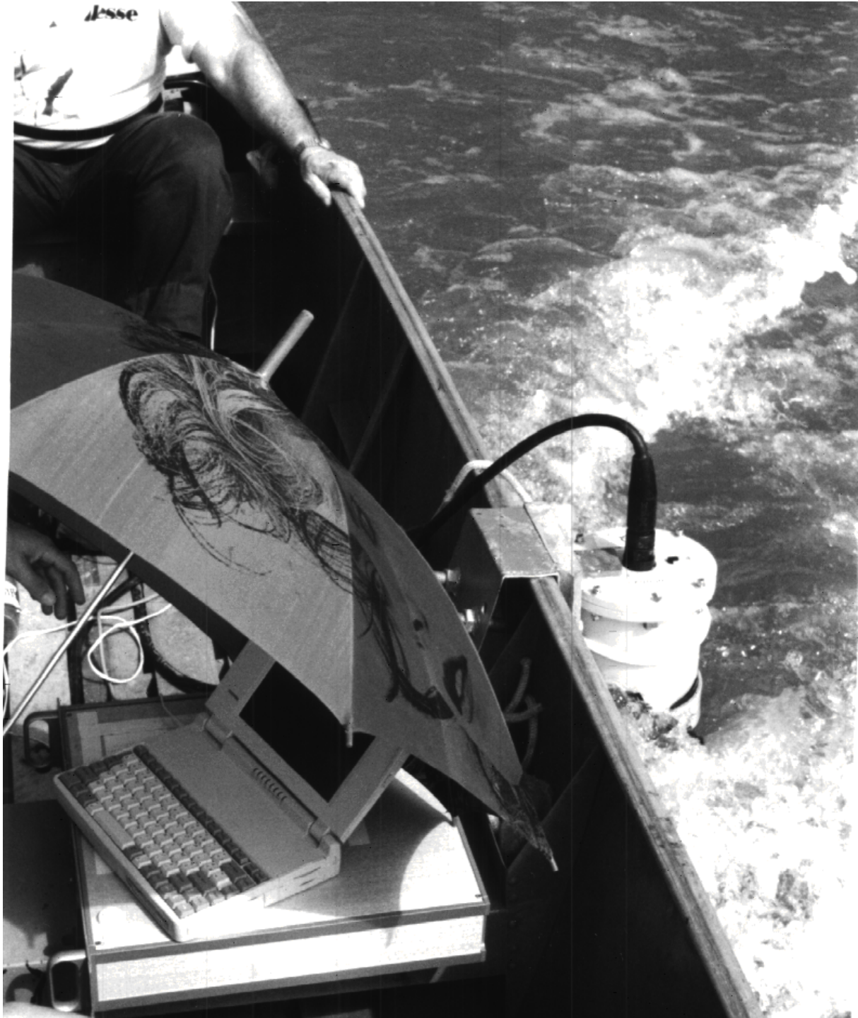
Adaptação do ADCP na voadeira

Neste tipo de meio muito turbulentos, o ADCP é a única ferramenta capaz de dar uma boa estimativa das vazões.