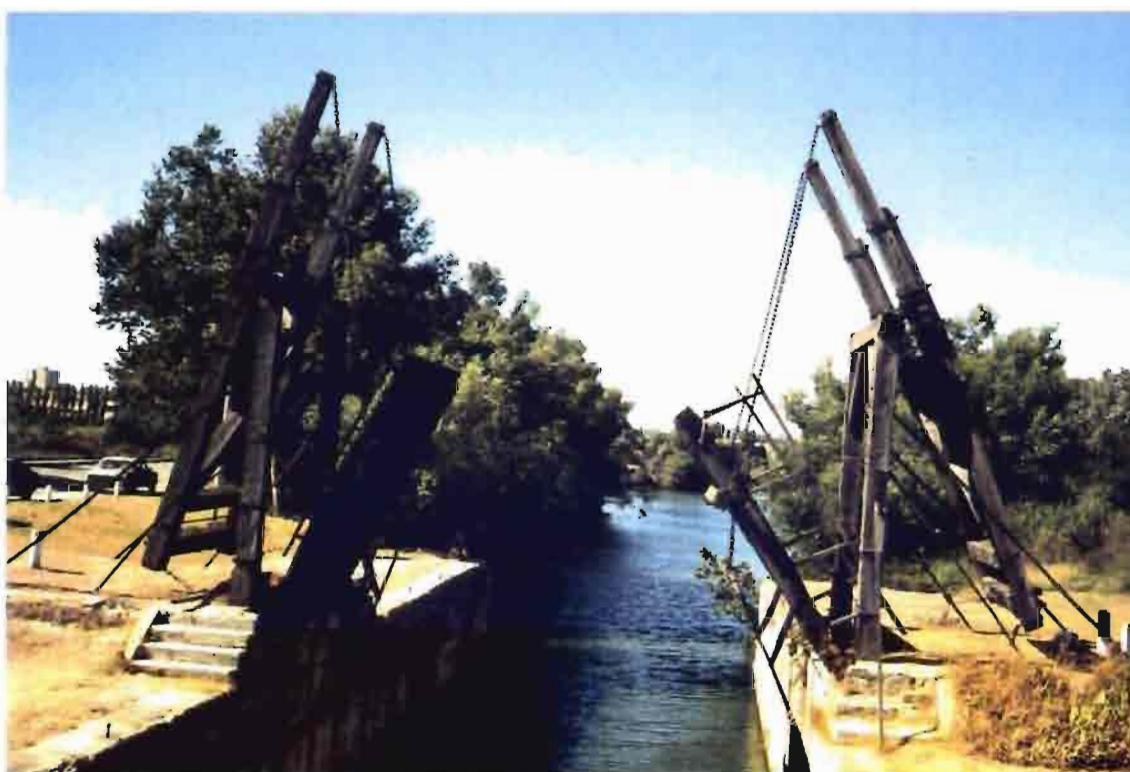
Le pont Van Gogh en Arles