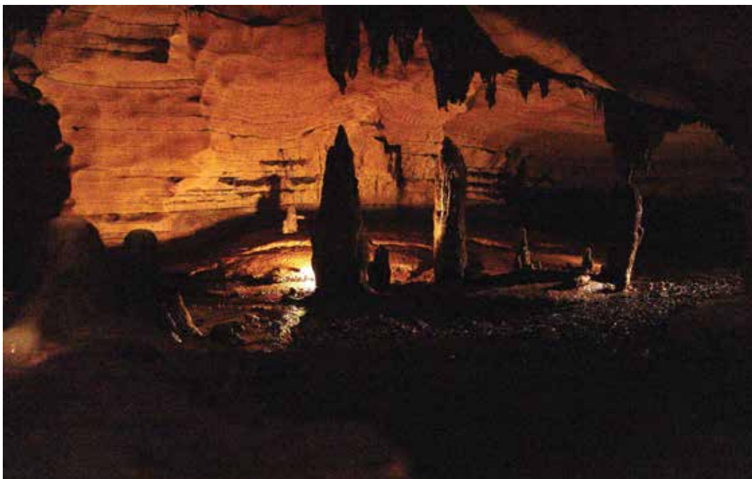
Figure 11. Galerie principale de Malébé avec de remarquables stalagmites.

que la rivière Louetsié contourne en une série de petits rapides. Le premier relevé topographique réalisé par Rouquette en 1952, révèle un réseau de conduits, galeries, salles, long de 1200 m avec des remarquables stalactites (Fig.12). La grotte s'ouvre au pied d'une petite falaise par un porche surbaissé et s'organise en une série de galeries labyrinthiques inter-communicantes, qui se recoupent à angle droit.