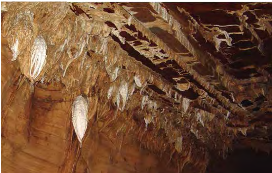
Figure 12. Grotte de Bongolo : plafond orné de rails de stalactites blanchâtres.

montre des galeries qui se développent sur trois niveaux superposés. Le développement total de cette cavité labyrinthique s'élève à 2380 m faisant actuellement de cette grotte, la plus longue topographiée au Gabon.