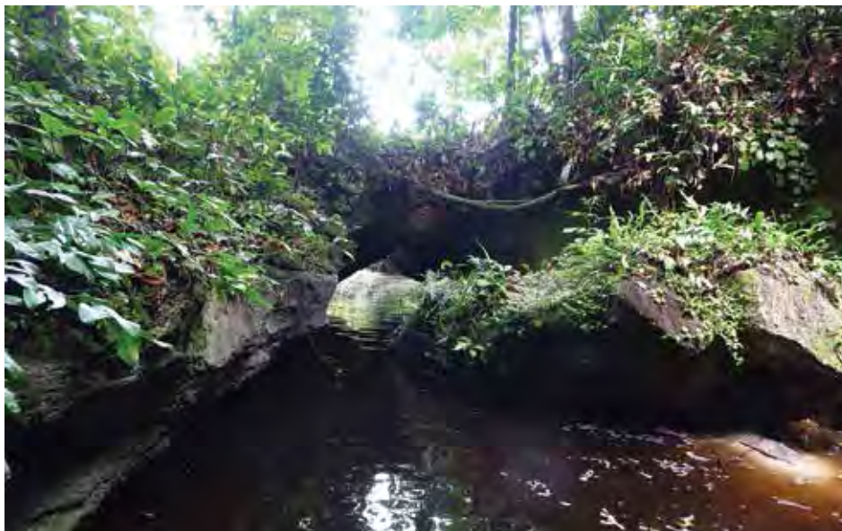
Figure 2. Arche de calcaire creusée par la rivière Mabagna.