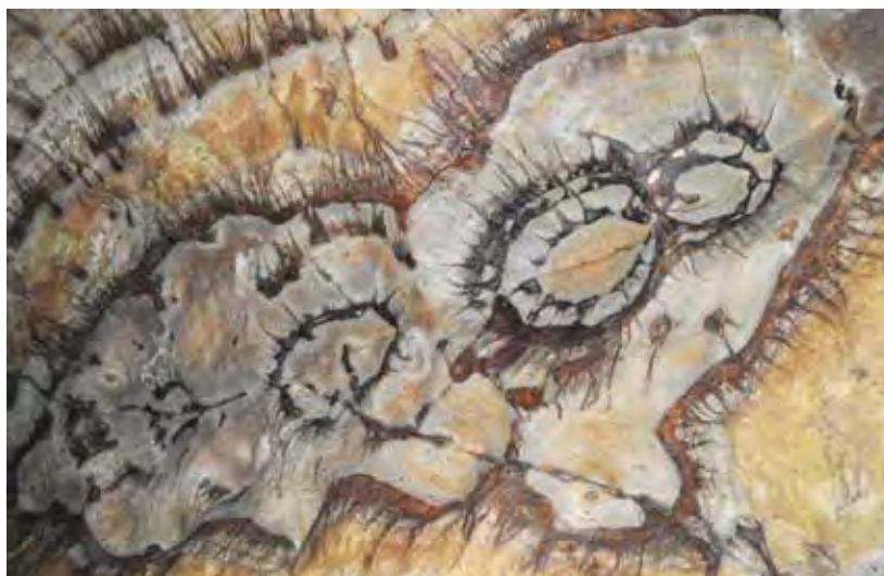
Figure 17. Fresques naturelles d'oxydes de fer de la grotte de Lihouma.

Dans une tranchée creusée dans le sol constitué en grande partie par du guano, on observe des niveaux charbonneux avec de nombreux fragments d'ossements de chauves-souris et l'on pense qu'à cet endroit des chasseurs cueilleurs de l'âge de la pierre