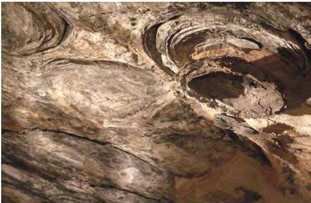
Figure 10. Plafond de stromatolithes dans la grotte de Ntsona.