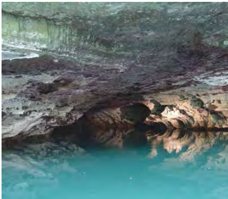
Figure 8. Vue sur le lac de la Grotte de Ngongongo.

La grotte de Ngongongo est occupée de manière permanente par un lac de résurgence (Fig.8) dont l'eau cristalline, en période de crue, se déverse dans la plaine voisine en alimentant le lac Massou à proximité du village de Nanga (Oslisly R. & Peyrot B. 2007).