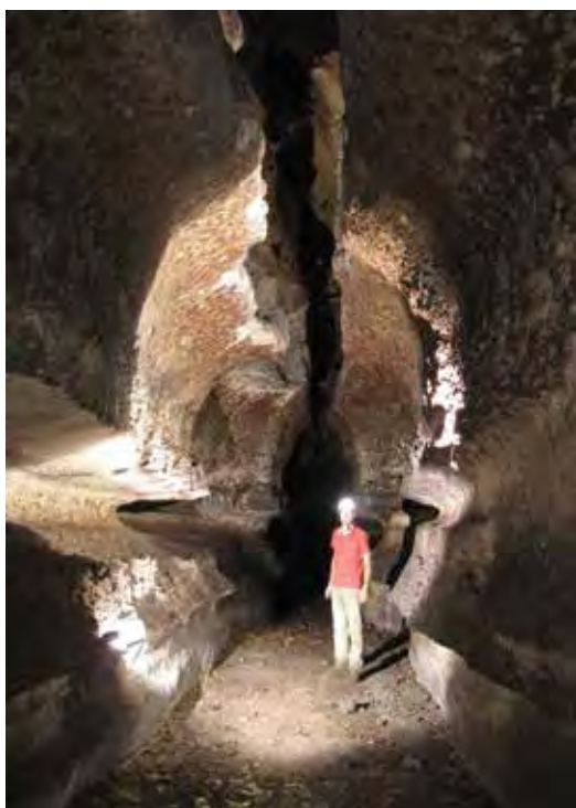
Figure 3. Grotte de Dinguembou en forme de trou de serrure.