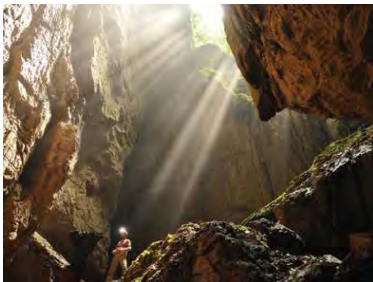
Figure 15. - Rayons de soleil dans le puits de la cavité de Siyou 1.

La grotte de Siyou 1 est une cavité de moyenne taille avec un couloir horizontal qui montre des stalactites, des draperies de calcite pour aboutir dans un puits creusé (Testa & Oslisly 2013) par le ruisseau qui chute de plus d'une dizaine de mètres (Fig.15).