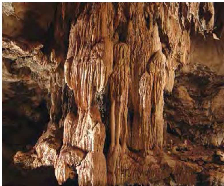
Figure 9. Draperie de calcite de la grotte de Yengué.

ceptionnel (Peyrot & Oslisly 2008) en raison des aspects paléontologiques, stratigraphiques et chronologiques. Ces organismes monocellulaires apparus sur terre dès 3,5 milliards d'années, constituent sous la forme de structures carbonatées, les formes de vie terrestres les plus anciennes. La cavité de Ntsona est une référence mondiale pour l'étude des stromatolithes, ce qui rend primordial leur préservation.