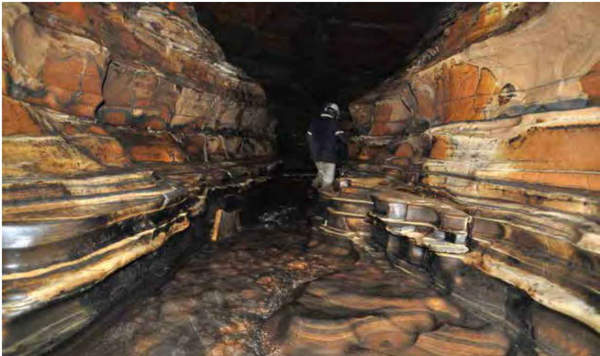
Figure 19. Ngongourouma : Canyon creusé dans les pélites et ampélites et dolomies rubanées.