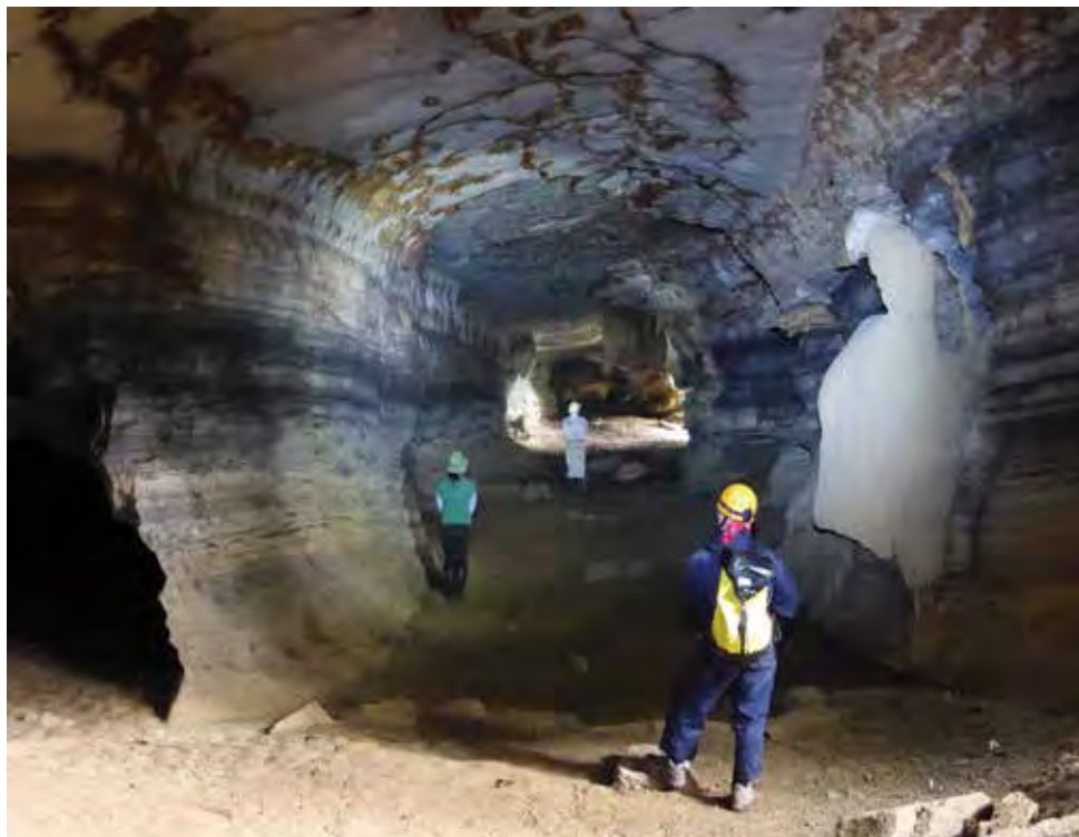
Figure 7. Grotte de Munumbumba avec sa galerie principale.

La grotte de Ndongou non loin du village d'Iroungou est une très grande et longue cavité avec un large couloir souvent ennoyé pendant la saison des pluies. Le plafond montre de manière parcimonieuse des bancs de stromatolithes.