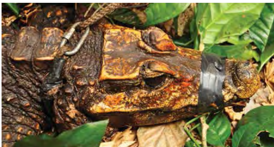
Figure 5. Crocodile muselé à la couleur orangee capturé dans la grotte Mugumbi.