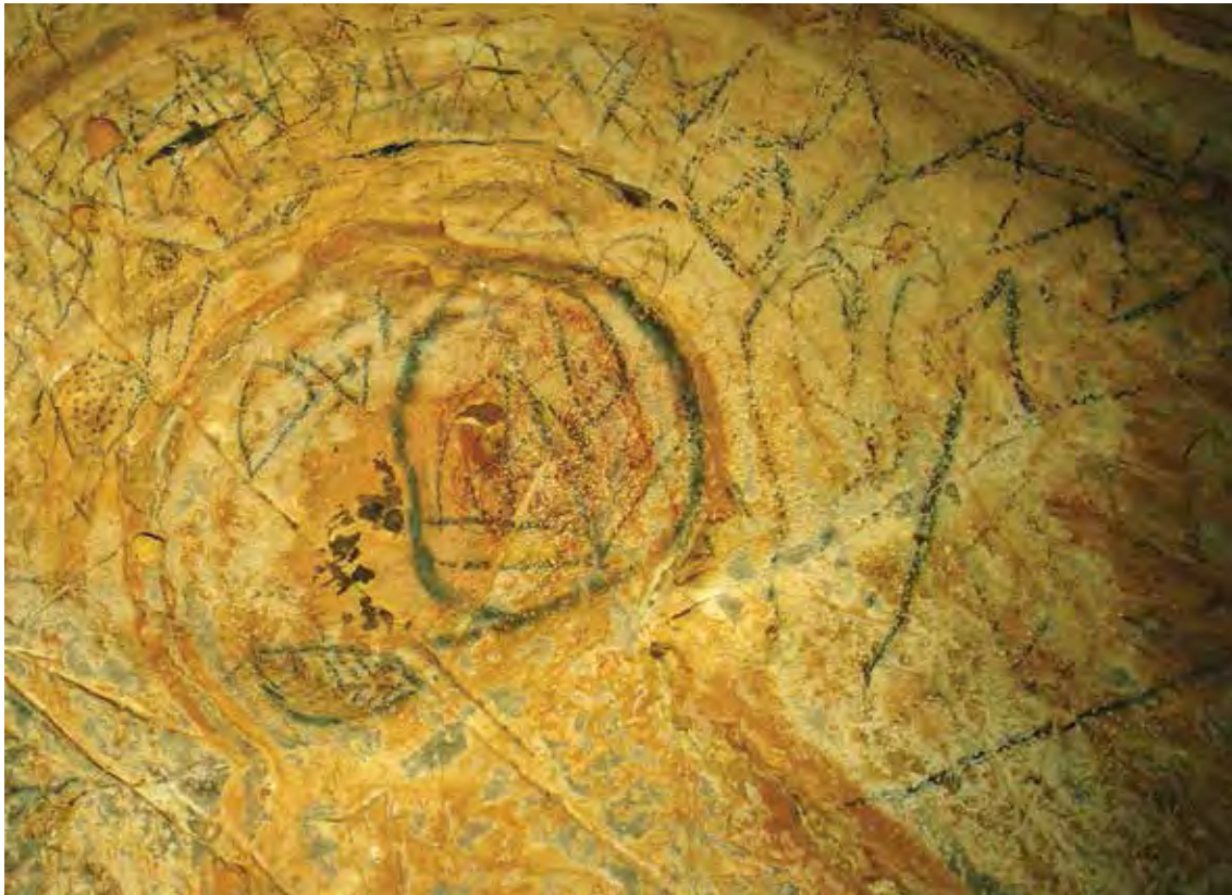
Figure 18. Cavité de Koubou : feuilles d'arbre dessinées aux charbons de bois.

récent, chassaient et fumaient les chauves souris en n'emportant que leurs corps. Ces scènes de chasse se sont déroulées entre 6000 et 9000 ans. Grace aux datations au carbone 14 nous savons maintenant que cette cavité a été parcourue par les hommes depuis 10.000 ans à nos jours.