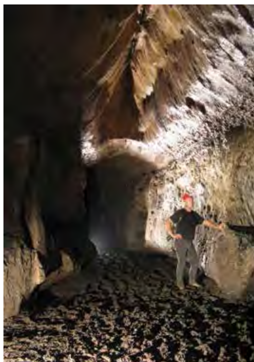
Figure 4. Vue sur la galerie principale de la grotte Mugumbi.