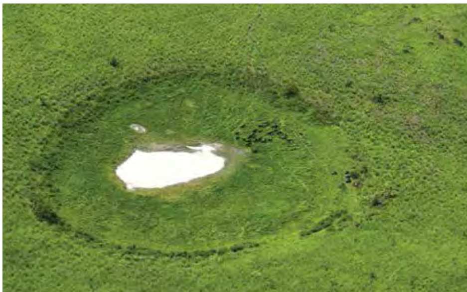
Figure 6. Doline du parc national de Moukalaba Doudou avec un troupeau de buffles

C'est grâce à deux expéditions spéléologiques tenues en 2007 et 2013 que certaines cavités de la région de Tchibanga ont été répertoriées (Arribart et al. 2009). A 4 km du centre ville de Tchibanga, à moins de 200 mètres du nouvel hôpital on peut apprécier le réseau de grottes de Mavoundi cachées