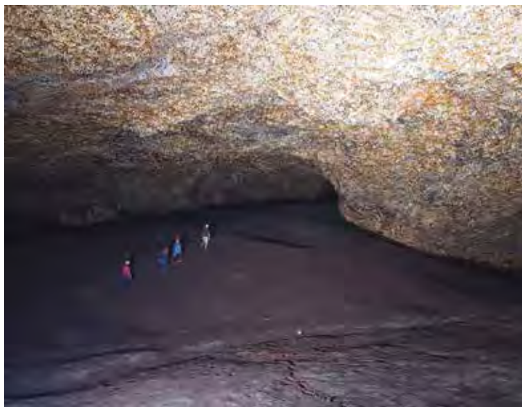
Figure 14. Grandes salles du fond de la grotte de Pahon.

La grotte de Siyou 1 est une cavité de moyenne taille avec un couloir horizontal qui montre des stalactites, des draperies de calcite pour aboutir dans un puits creusé (Testa & Oslisly 2013) par le ruisseau qui chute de plus d'une dizaine de mètres (Fig.15).