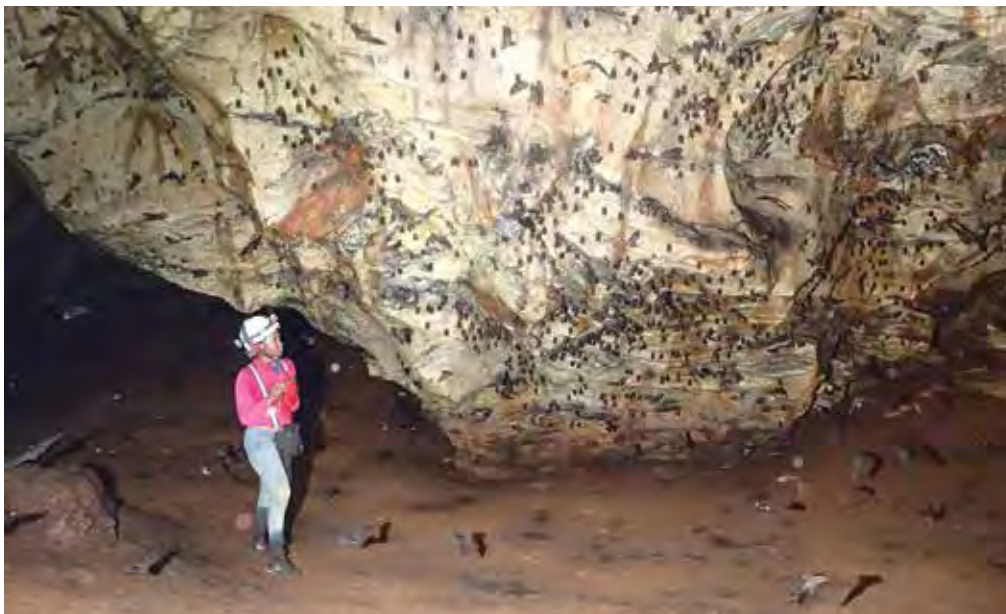
Figure 16. Grotte de Missié ; paroi couverte de chauves souris.

La cavité de Lihouma 1 est une grotte tunnel ornée de belles concrétions de morphologies diverses munie d'un petit ruisseau qui traverse la colline de part en part sur 80 m. La spécificité de cette cavité est qu'elle dévoile au plafond une succession de superbes fresques minérales très colorées (Fig. 17) par les suintements d'oxydes de fer