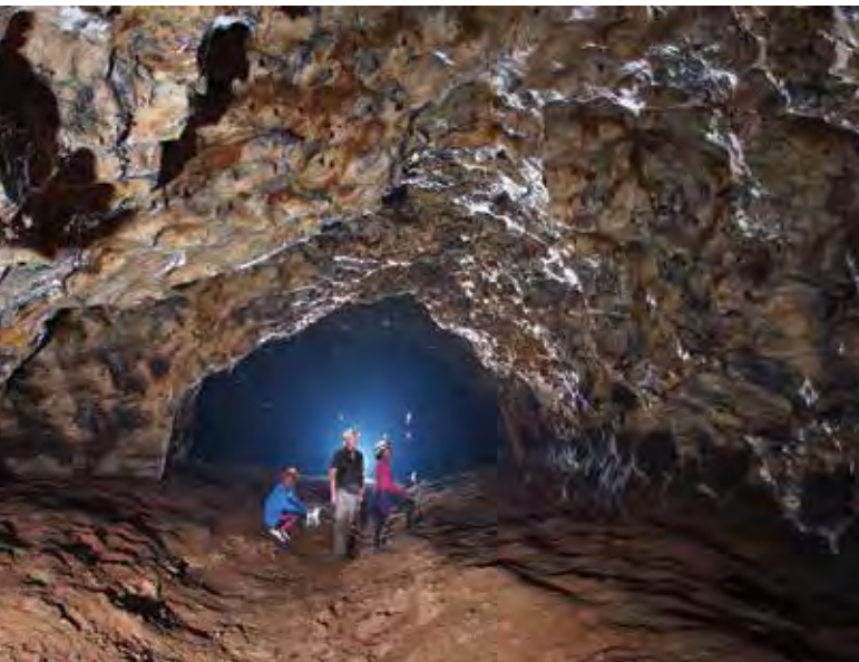
Figure 13 ; Grotte de Pahon. Tunnel de la grande salle du fond

La grotte de Pahon est la plus connue car l'entrée et la première salle sont imposantes ; si d'aventure on suit le couloir resserré où s'écoule le ruisseau, on aboutit à de très grandes salles (Fig. 13 & 14) dont les parois abritent plus de 500 000 chauves souris. Les fouilles archéologiques de 2003 ont révélé une stratigraphie constituée de couches de niveaux de charbons, pierre taillées et de guano vieille de 7000 ans.