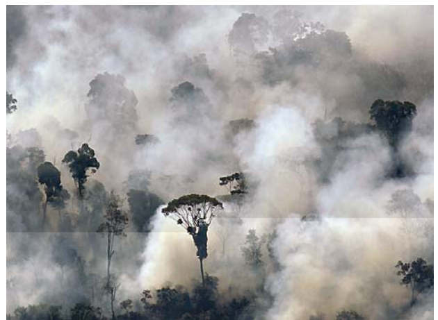
Nécessité d'une réglementation internationale : la FAO estime que 15 millions d'hectares de forêts disparaissent chaque année.

Au-delà de la nécessité de répondre à la menace d'une "sixième extinction de masse" et de multiplier les aires