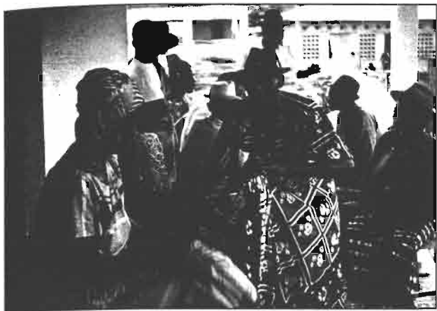
Abidjan, quartier populaire

évidente pour ceux qui se sont installés depuis des générations dans la capitale ivoirienne et qui se retrouvent dans l'obligation de s'identifier par rapport à une nationalité que beaucoup d'entre eux avaient oublié pour s'être investis, sans réserve, dans le développement de la Côte d'Ivoire.