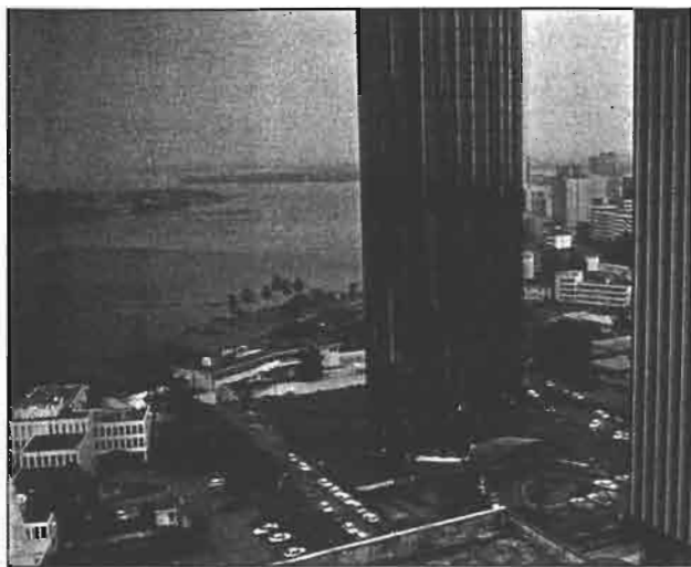
Abidjan moderne

s'établirent non sans heurts entre autochtones et étrangers dans la valorisation du foncier rural (Dupire M., 1960).