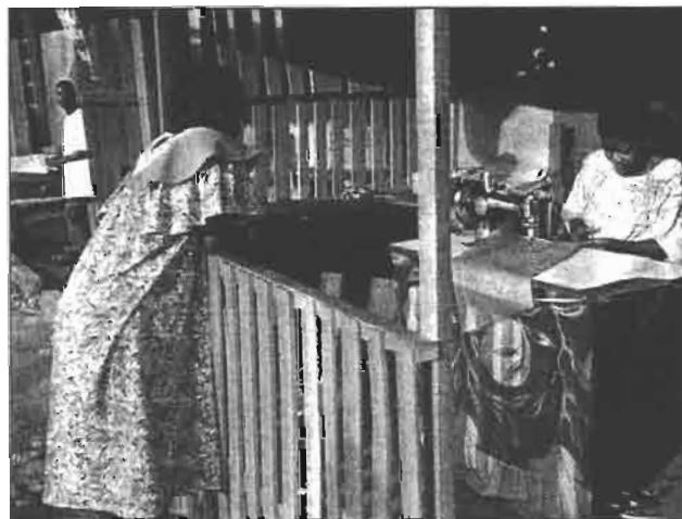
Quartier populaire à Abidjan

« Vous voyez les jeunes qui jouent au foot derrière ma maison ? Quand ma femme grille les galettes, elle reçoit leur ballon et autres choses liées à l'excitation autour du terrain. Et nous n'avons pas le droit de nous plaindre. Chaque fois que je leur dis cela, on me dit "va