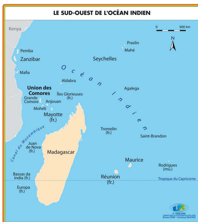
Figure 1 – Le Sud-Ouest de l'océan Indien