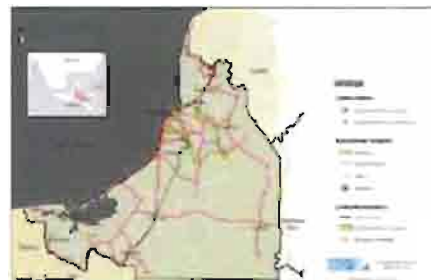
Estructura territorial del Estado de Campeche: principales localidades y vías de comunicación

El municipio de Campeche se localiza al Oeste de la Península de Yucatán y cuenta con 3,200 kms 2 de superficie; alberga a la capital del estado, conocida como San Francisco de Campeche con una población de 220,389 habitantes en el año 2010. Desde una perspectiva topográfica, el territorio del municipio de Campeche, como el del resto del estado presenta una gran regularidad con poco relieve y alturas que varían de cero a más de 200 metros s.n.m. El municipio cuenta con un poco más de 40 kms. de litoral. Campeche está inscrito en la Lista del Patrimonio Mundial de la Unesco 1999 pues cuenta con un patrimonio original en México por la presencia de vestigios de arquitectura militar, siendo la única ciudad amurallada en el país.