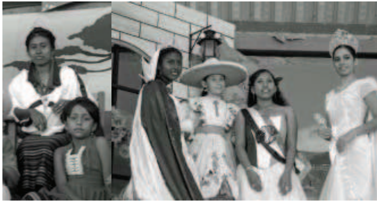
Figura 5: Fiesta Patria en Pinotepa Nacional, Oaxaca. Las Reinas Indígena, Negra, Charra, Fiestas Patrias y América (de derecha a izquierda respectivamente), Foto Gloria Lara Millán.

Otro efecto que se observa son las «nuevas alianzas» locales, que llegan a ser incluso estatales y nacionales y que por momentos borran o matizan las lógicas tradicionales de distinción y rivalidad entre partidos. Así observamos posturas inéditas entre los grupos políticos más visibles que abanderan o apoyan la movilización afro. En el caso de Oaxaca la movilización afro se acerca más al PRD, que supuestamente representa la sensibilidad de izquierda y defiende los derechos de los marginados, entre ellos los negros. En el estado vecino, Guerrero, encontramos la configuración opuesta: son los PRIístas que lo activan, con un senador que propone el reconocimiento legal de los afroestizos como grupo étnico, y en el estado de Veracruz, en Playa Vicente, son los panistas (pertenecientes al Partido Acción Na-