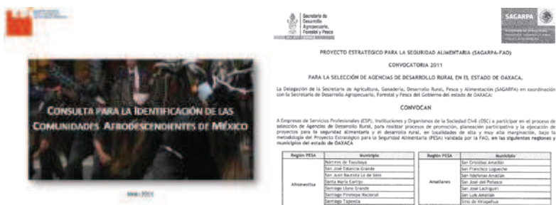
Figura 4: ejemplos del reciente reconocimiento gubernamental hacia los afrodescendientes: las iniciativas de la CDI y la SAGARPA (2011)