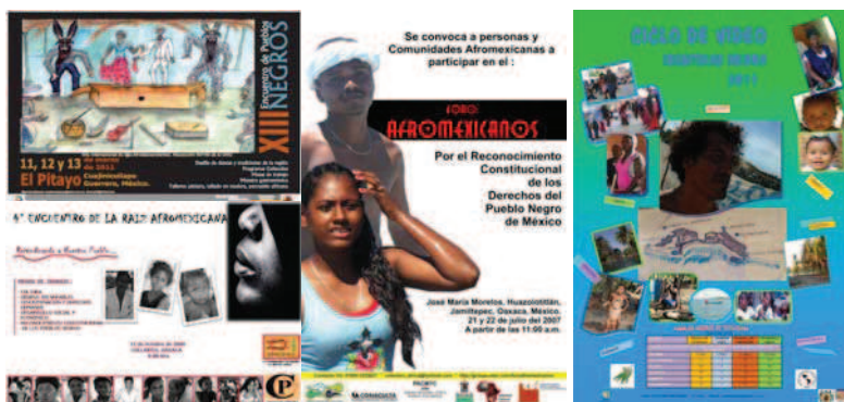
Figura 2: Afiches de eventos que visibilizan el tema afro al interior de la región de la Costa Chica