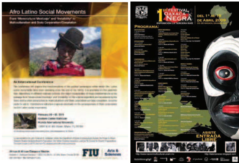
Figura 3: dos eventos recientes organizados por la Florida International University en 2011 y por la UNAM en 2009, respectivamente.

tado en tres esferas u organizaciones de la costa chica (México Negro, AFRICA, el Museo de Culturas Afromestiza) y sus alianzas igualmente se restringían a las principales agrupaciones de redes afro transnacionales: Afroamérica XXI, Mundo Afro. Esto ha cambiado con la internacionalización que se intensifica a partir de los años 1990-2000, mediante varios fenómenos. El primero se refiere a lo que podríamos llamar cierta « efervescencia académica », con un número creciente de universitarios mexicanos y extranjeros que hacen aportaciones a este tema (ver figura 3). En particular, los académicos extranjeros aportan la legitimidad, el «label científico», la validación que tanto cuesta construir en México sobre este tema, a la vez que difunden los discursos, argumentaciones y teorías imperantes en las esferas universitarias y políticas internacionales.