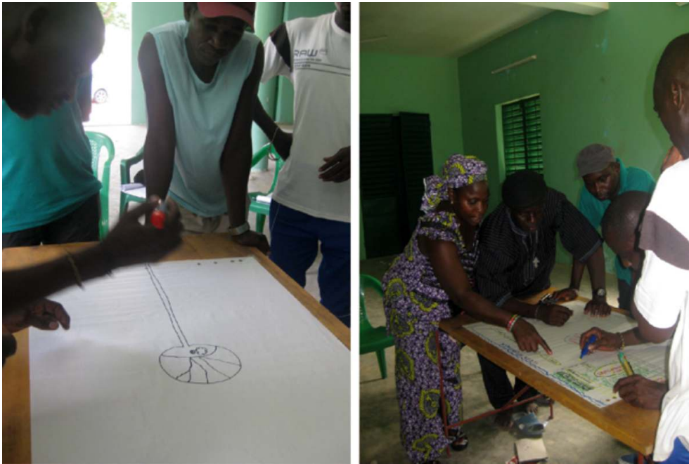
Figure 3 : Construction de la carte du terroir rizicole de Diembéring, Sénégal

(Cormier Salem & Sané, ce volume). Dessinée sur une feuille de papier, la route constitue souvent le premier élément tracé. Elle est suivie des autres points de repères de la communauté, souvent des repères naturels, comme le montre la figure 3 où les villageois ont dessiné le fromager géant qui est l'emblème du village de Diembéring, puis les quartiers ont été délimités avec une géométrie approximative. Les infrastructures scolaires et sanitaires ainsi que les unités paysagères (dunes, mangrove, rizières) viennent compléter la carte. La toponymie est utilisée pour nommer les quartiers, indiquer les directions (canal, piste) et les zones de passage.