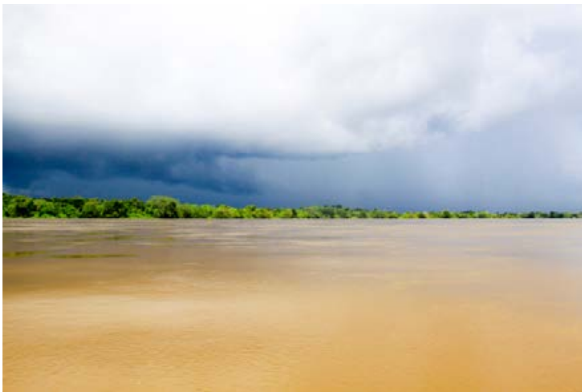
Foto 1: El río Amazonas, un gigante de líquido y de sedimentos. Foto cerca de Iquitos (Perú), donde ya el río alcanza 1 km de ancho y 40 metros de fondo. El color de sus aguas es debido a la fuerte concentración de arcillas y arenas.

esta cuenca y sigue teniendo un papel muy importante hoy en día. Con el 11% de la superficie de la cuenca, los Andes constituyen un obstáculo para las masas de aire húmedo provenientes del Atlántico Tropical Norte, también son la principal fuente de producción sedimentaria (95% de los sedimentos de la cuenca provienen de los Andes, y representan 8% de los aportes mundiales) y de elementos disueltos (6% de los aportes mundiales) transportados por el río hacia el océano. Particularmente activo, el frente oriental de la cadena es una zona rica en biodiversidad.