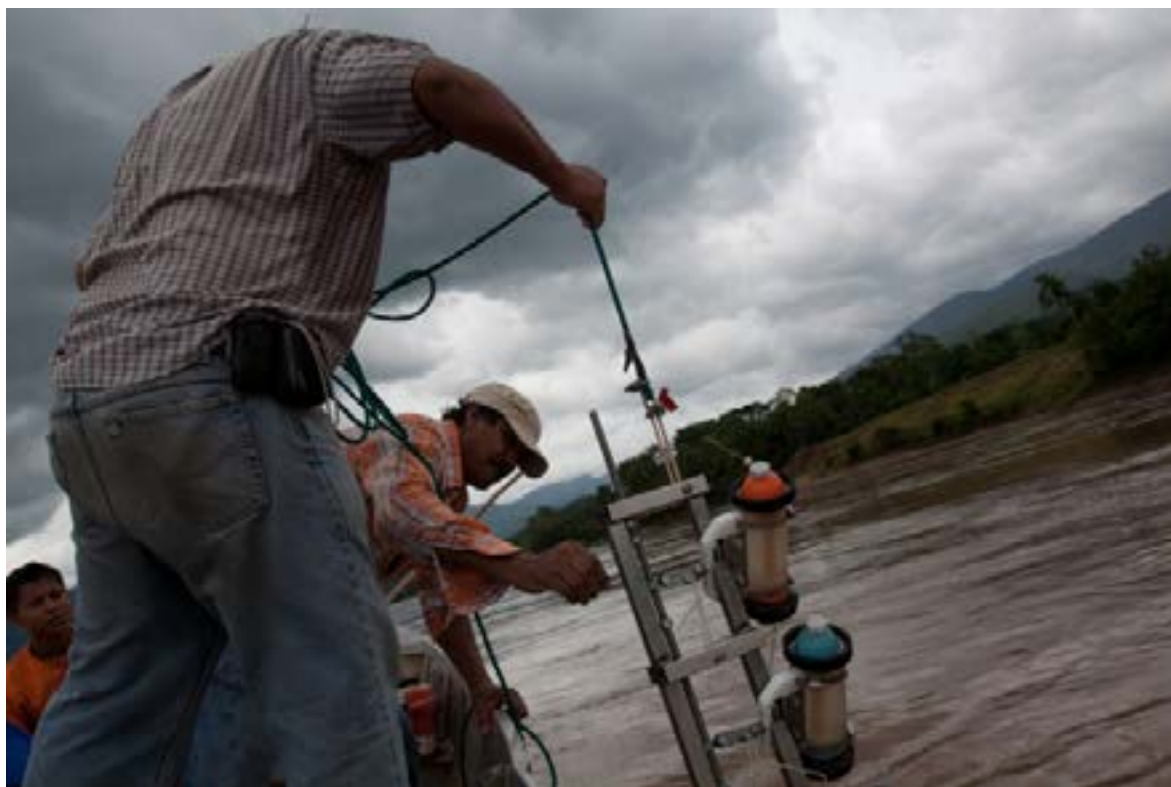
Foto 2: Maestro de sedimentos en los piedemontes Andinos de la cuenca del río Huallaga (Perú).

realizada por el observador) con la concentración media de la sección. Esta relación permite luego determinar los flujos sedimentarios diarios.