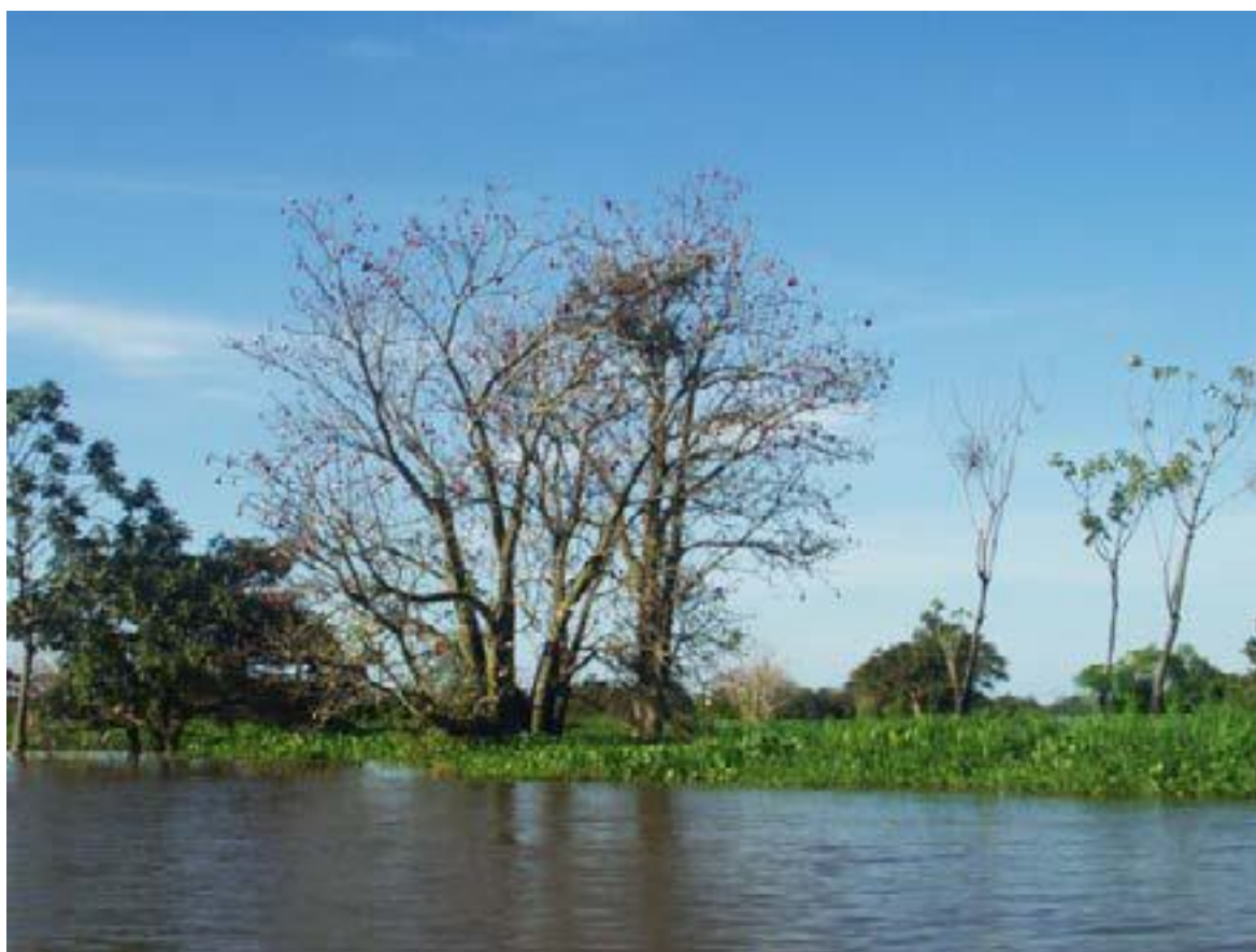
Lagos de inundación (aguas blancas).

Los lagos de inundación (aguas negras, claras y blancas) a pesar de los pocos estudios que han sido realizados hasta la fecha [5,7,8], pueden ser caracterizados por tener tasas de sedimentación relativamente altas en comparación con otros lagos aislados de la región amazónica.