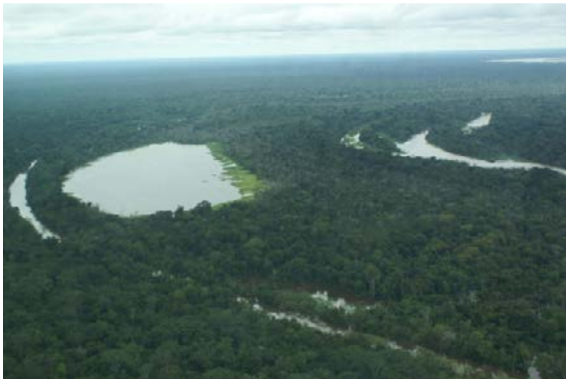
Foto aérea de los lagos de inundación del Perú, región de Iquitos.

Las influencias antropogénicas (causadas por acciones del hombre) están causando un cambio climático global. Algunos de los cambios que podemos observar al respecto están relacionados con el aumento del contenido de humedad en la atmósfera, el cambio en los patrones de precipitación sobre los continentes, la intensificación de la precipitación y principalmente, el aumento del carbono en la atmósfera. Estudios globales estiman que las aguas continentales reciben alrededor de 1,7 a 2,7 PgC (1 PgC = 1 Peta-gramo de carbono = 1 000 millones de toneladas de carbono) por año viniendo de los suelos, de los cuales, 0,8 a 1,2 PgC vuelve a la atmósfera en forma de CO 2 ; 0,9 PgC se entrega al océano y alrededor de 0,2 a 0,6 PgC por año está enterrado en los sedimentos continentales en