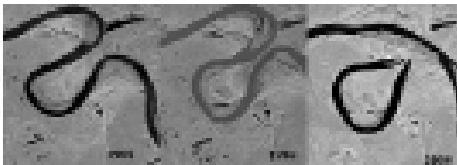
Dinámica de la migración de los meandros del Río Ucayali.

Una peculiaridad de la zona alta de la cuenca amazónica es el activo dinamismo en la creación y el desarrollo de los meandros. Existen lugares donde se puede observar, en unas pocas décadas, el nacimiento y la muerte de un meandro. La Amazonía peruana está drenada por numerosos afluentes de diferentes tamaños de ancho, descarga líquida, carga sedimentaria, pero igual contexto geo-estructural. Para el caso de los ríos que fluyen en la cuenca del Río Marañón, tienden a tener un cierto grado de estabilidad, donde la línea central del río no cambia dramáticamente durante décadas, aunque se observan cicatrices de un pasado más activo que el actual. La situación es diferente para los ríos ubicados en la cuenca del Río Ucayali: parece que el propio Ucayali y algunos afluentes buscan el equilibrio constantemente a través de la alta dinámica de sus meandros. Eso incluye corte del meandro (llamado “cut off”) y procesos de cambio en el curso del río (llamados avulsiones). Ciertos factores externos (como los relieves, el régimen hidrológico, los aportes de sedimentos, la vegetación, etc.) explican estas diferencias entre los ríos peruanos.