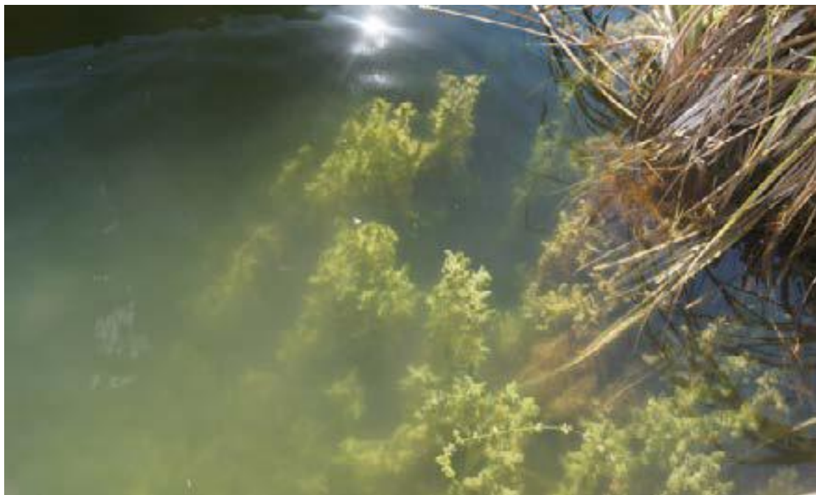
Presencia de vegetación sub-acuática en los lagos.

más productivos del mundo. Se estima que la producción orgánica para estos sistemas llega a cerca de 8,4 millones de toneladas de carbono por año, donde las macrófitas contribuyen con cerca de 5 millones de toneladas ; los árboles y las gramíneas con cerca de 2,4 millones de toneladas y el plancton con 1 millón de toneladas de carbono por año [1]. La producción orgánica, en los diferentes sistemas de lagos de inundación amazónicos, está principalmente influenciada por el tipo de agua (blanca, negra y clara). Los lagos, así como los ríos amazónicos, son conocidos y clasificados en función de sus características físico-químicas como son el pH, la concentración de sólidos en suspensión, la concentración de materia orgánica disuelta, la productividad acuática, etc. El conjunto de estas características da origen a diferentes tipos