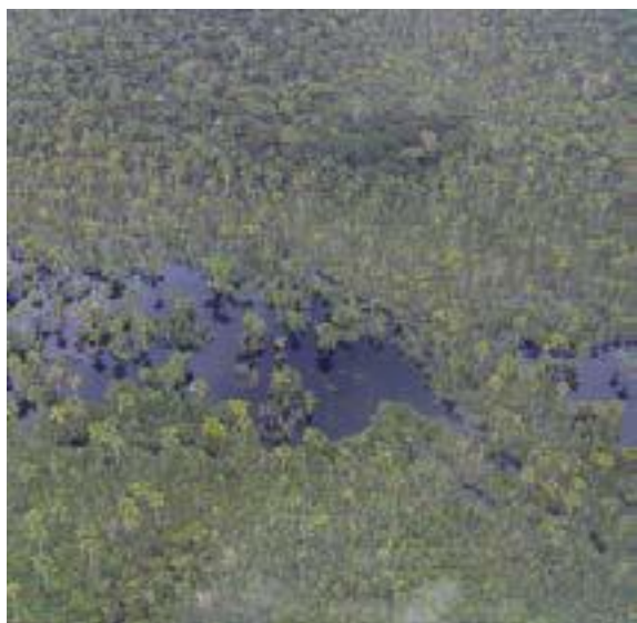
Lagos de inundación (aguas negras).

En el caso de los lagos más influenciados por el río, las tasas de sedimentación mayores de hasta algunos centímetros por año serán caracterizadas por una tasa de acumulación de carbono mayor (pudiendo alcanzar hasta 100 g de carbono/m 2 /año) a pesar de las