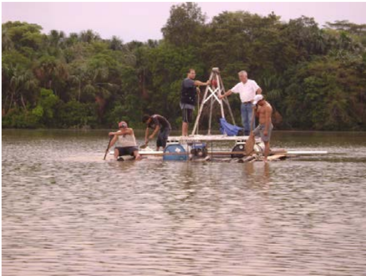
Plataforma para la colecta de testigos en lagos (Lago Quistococha, Iquitos).

La sedimentación en los lagos de inundación no es un proceso uniforme y constante ni espacialmente ni temporalmente. Los ríos son muy dinámicos y, por lo tanto, la sedimentación en los lagos de las planicies de inundación se ve afectada por dicha dinámica. Un primer caso es una sedimentación progresiva, producto de las inundaciones estacionales del río. Otro caso es una sedimentación caracterizada por sedimentos más gruesos aportados por la mayor energía de inundaciones más fuertes. Y finalmente, durante algunos eventos hidrológicos extremos, se observa el depósito de paquetes sedimentarios caracterizados