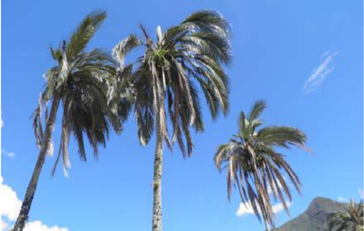
Foto 1: Parajubaea cocoides . Parajubaea es un género endémico de los bosques secos andinos, aunque el origen exacto de esta especie en particular es incierta. Se encuentra cultivada desde el sur de Colombia hasta el norte de Perú.

región caribeña, la costa Pacífica y estribaciones andinas de Ecuador y del Perú, el piedemonte andino y valles interandinos orientales en Colombia, Perú y Bolivia, y dispersos en varias partes de Brasil entre la Amazonía y la Mata Atlántica, en particular en el dominio de la caatinga (una ecorregión semiárida) en el nordeste de Brasil [8]. En la parte occidental de la distribución de estos ecosistemas, se destaca la presencia de palmeras del género Phytelephas , que producen las semillas conocidas como marfil vegetal (o tagua).