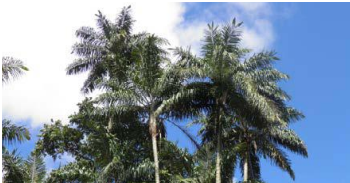
Foto 2: Ceroxylon peruvianum es una especie endémica del bosque sub-húmedo montano en Cajamarca y Amazonas, el cual forma una estrecha franja de transición entre el bosque seco y el bosque nublado.