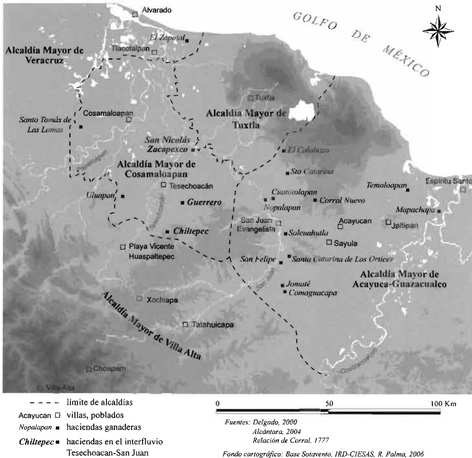
FIGURA 6 Principales estancias ganaderas y haciendas a fines del siglo XVII

y Tlacotalpan, aunque de difícil acceso por los ríos y pantanos que les franqueaban, sus tierras nunca llegaron realmente a parecer verdaderas haciendas, es decir asentamientos caracterizados por tener habitaciones centrales –la dicha casa grande de otras partes– y anexos como molinos, bodegas, viviendas para peones; o al menos no restan vestigios visibles de ellos (véase figura 6).