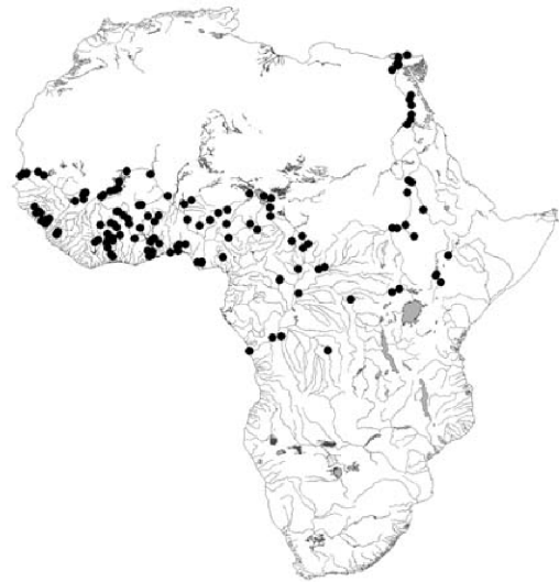
Fig. 2. Lates niloticus : répartition naturelle de l'espèce.

Poisson recherché par les pêcheurs sportifs, il représente pour les pêcheurs locaux une providence économique très intéressante. En revanche, les populations locales s'en nourrissent peu – on connaît, à cet égard, la réticence habituelle des populations à consommer une nourriture nouvelle. De plus, n'ayant pas la pratique du fumage ou du séchage de spécimens de grosse taille, elles n'ont pas trouvé initialement la façon de le conserver.