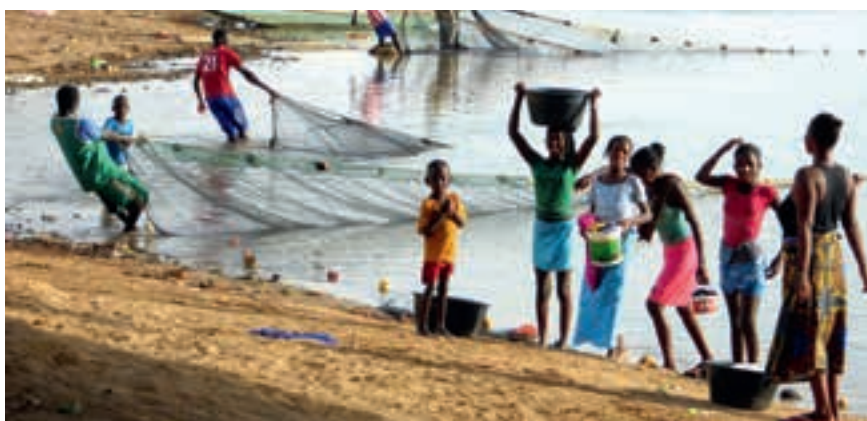
◀ Pêcheurs dans la vallée du fleuve Sénégal près du lac de Guiers.