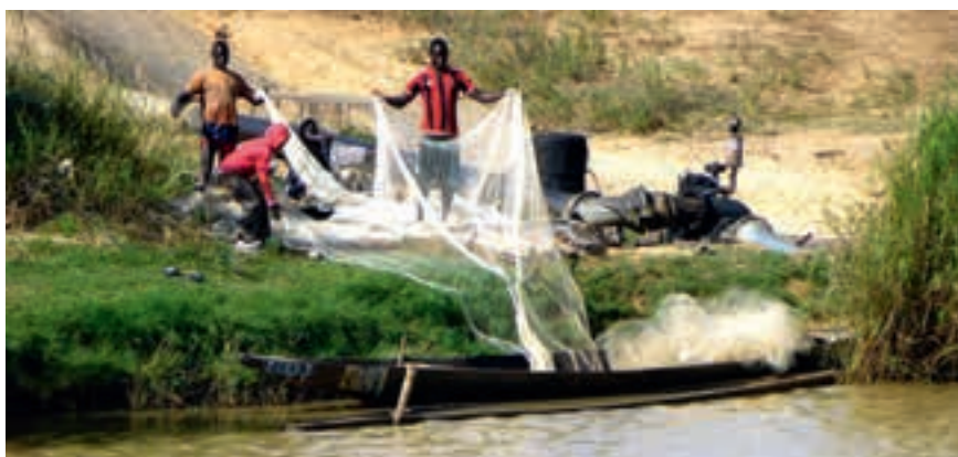
◀ Pêcheurs et pompage pour l'irrigation dans la vallée du fleuve Sénégal près de Podor.