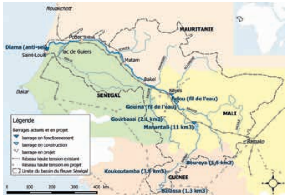
► Carte du bassin du fleuve Sénégal avec les barrages actuels et en projet

Contacts : J.-C. Bader, jean-claude.bader@ird.fr et J.-C. Pouget, jean-christophe.pouget@ird.fr (UMR G-EAU)