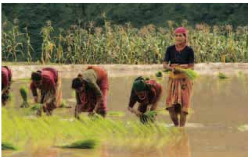
Repiquage du riz