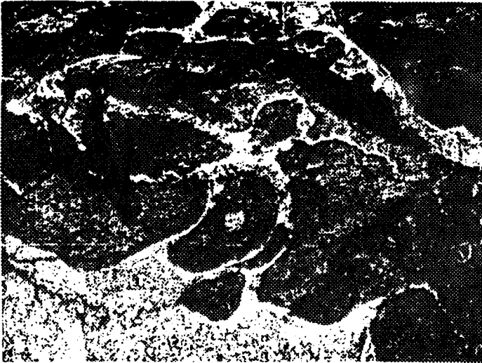
Fig. 3- Detalle de la fig. 2. Notéase la dispersión típica de magmas félsicos y máficos no consolidados y no mezclados homogéneamente, junto con zonas de separación, con caracteres mixtos, entre la parte más básica y el granitoide encajante.