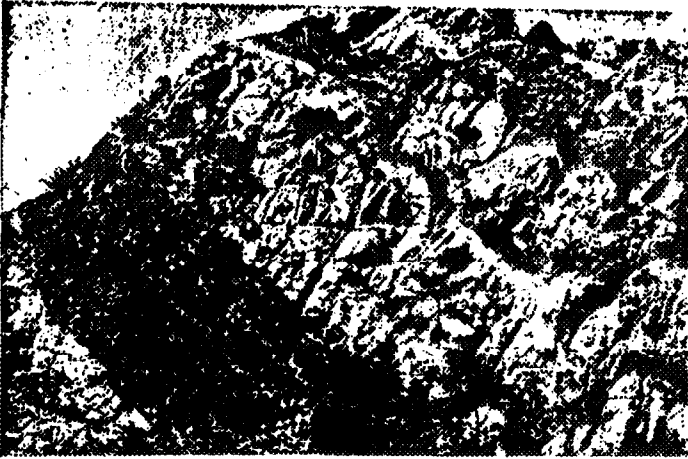
Fig. 2- Aspecto general de las intrusiones máficas (dioritas y cuarzo-dioritas, esencialmente). Observéanse las venas pegmatíticas en el granitoide encajante y, sobre todo, en los contactos entre ambos tipos plutónicos.