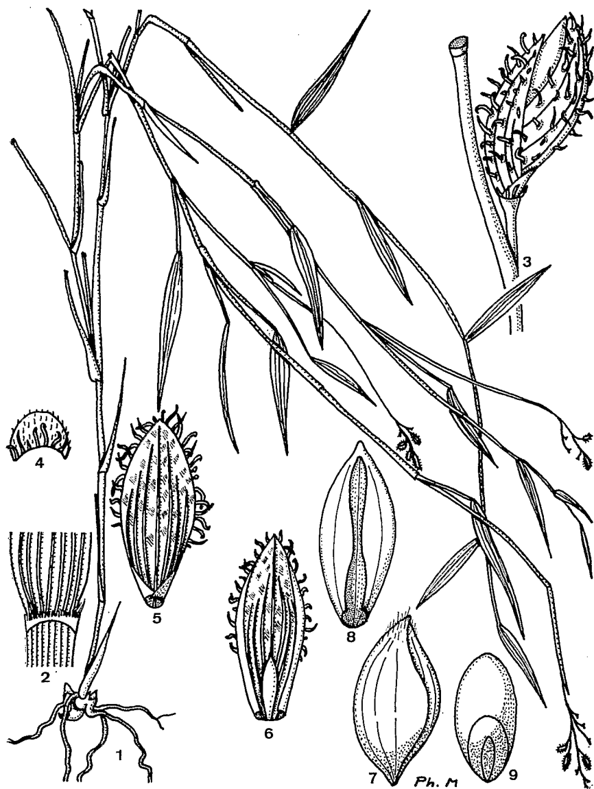
Pl. 3. — Ancistrachne numænsis (Balansa) Blake : 1, port et aspect général; 2, ligule; 3, épillet, vue latérale \times 10 ; 4, glume inférieure, face externe; 5, glume supérieure, face interne; 6, fleur inférieure, lemma et palea; 7, fleur supérieure \sigma à maturité; 8, lemma fertile; 9, caryopse.