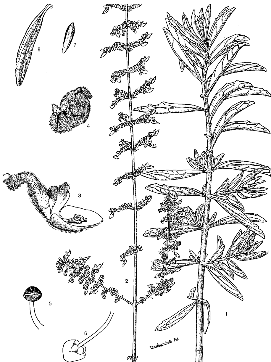
Pl. 2. — Burnatastrum lanceolatum (Boj. ex Benth.) Briq. : 1, rameau stérile \times \frac{2}{3} ; 2, inflorescence \times \frac{2}{3} ; 3, fleur; 4, fruit; 5, étamine; 6, ovaire; 7, feuille de saison sèche; 8, feuille de saison humide.