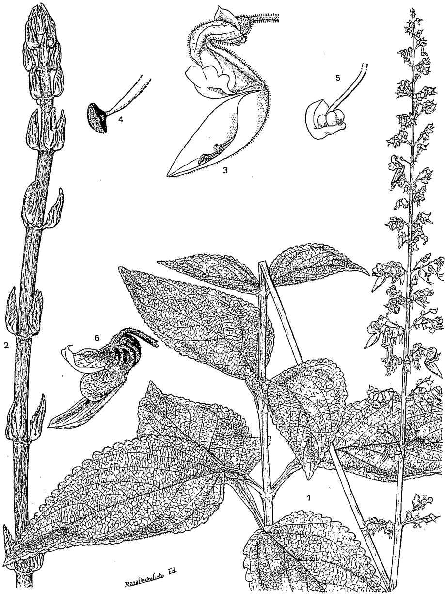
Pl. 3. — Solenostemon rutenbergianus (Vatke) J.-L. Guillaumet & A. Cornet : 1, rameau fleuri avec feuilles de saison humide \times \frac{2}{3} ; 2, rameau de saison sèche \times \frac{2}{3} ; 3, fleur; 4, étamine; 5, ovaire; 6, fruit.