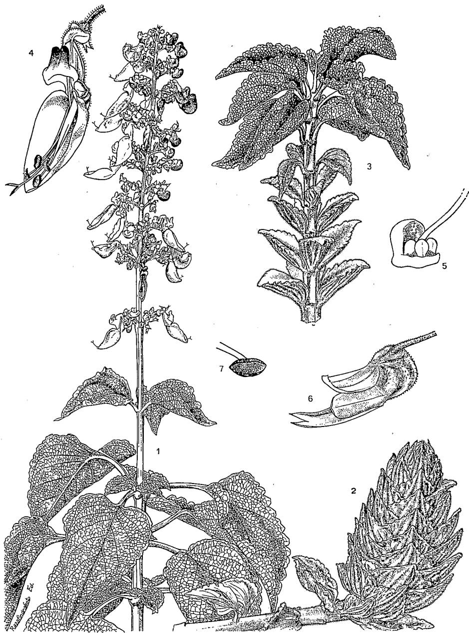
Pl. 4. — Solenostemon veyretæ J.-L. Guillaumet & A. Cornet : 1, rameau fleuri avec feuilles de saison humide \times \frac{2}{3} ; 2, rameau de saison sèche \times \frac{2}{3} ; 3, apparition des feuilles de saison humide sur un rameau de saison sèche \times \frac{2}{3} ; 4, fleur; 5, ovaire; 6, fruit; 7, étamine.