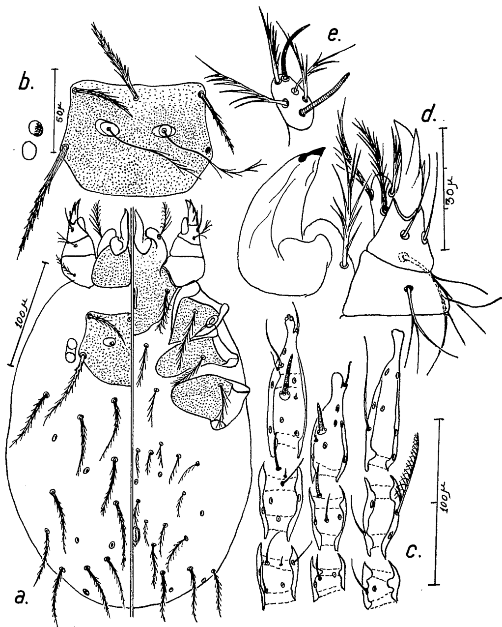
FIG. I. — Neotrombicula (N.) zairiensis n. sp. a. ensemble ; b. scutum ; c. pattes ; d. palpe, galea et chélicère (dorsal) ; e. tarse palpal (ventral).