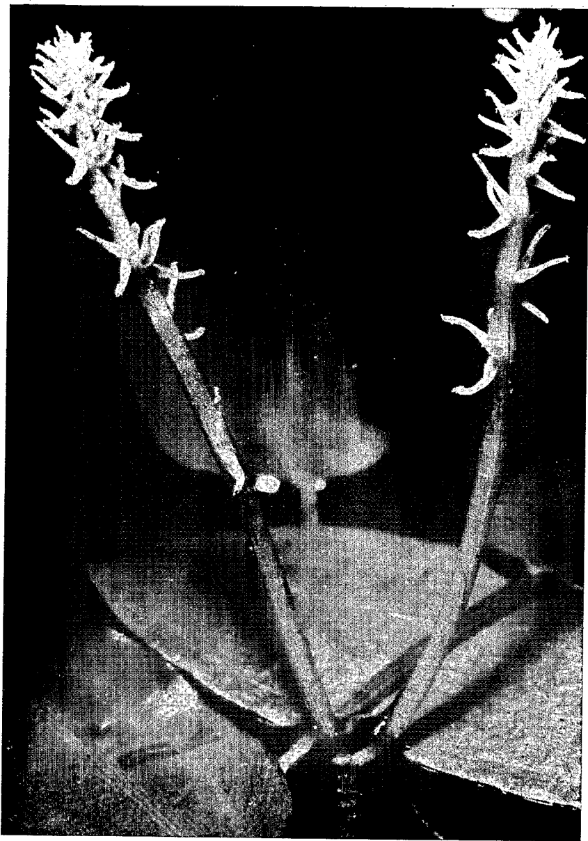
Pl. 3. — Aponogeton Decaryi : inflorescence femelle.