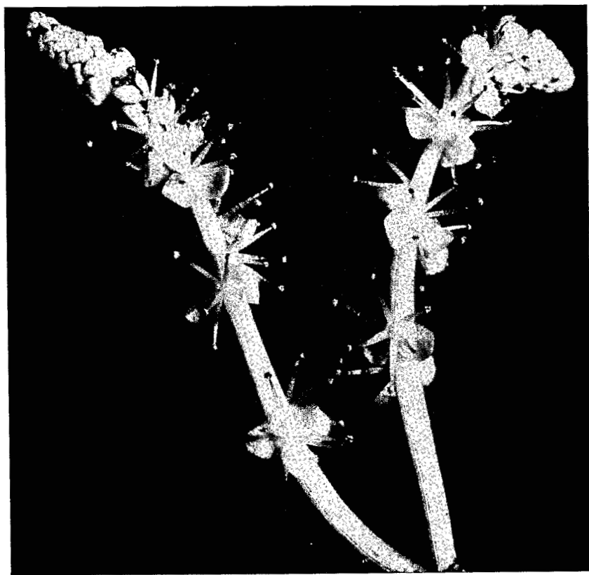
Pl. 2. — Aponogeton Decaryi : en haut, peuplement de pieds mâles (à droite, une inflorescence femelle); en bas, inflorescence mâle. (Photos H. W. E. VAN BRUGGEN).