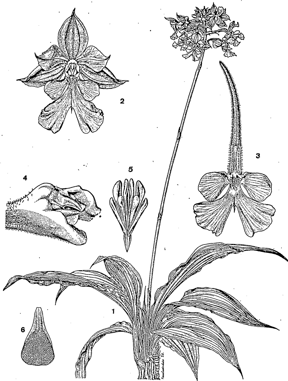
Pl. 1. — Calanthe Millotae Ursch et Genoud ex Bosser ; 1, port de la plante ; 2, fleur vue de face ; 3, labelle et éperon ; 4, colonne vue de 3/4 ; 5, pollinies ; 6, anthere vue de dessus.