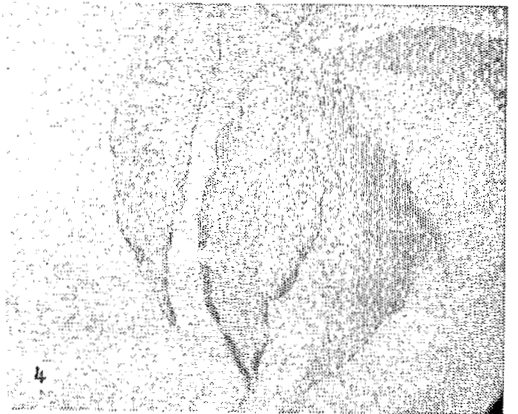
Fig. 1.- Daño de Tuthillia cognata (Homoptera Psyllidae); a izquierda 2 hojas deformadas, a derecha una hoja sana.