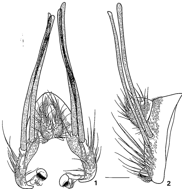
Fig. 1 à 2, Cladochaeta ptyelophila Tsacas n. sp., mâle. — 1, épandrium et organes annexes en vue caudale. — 2, id. en vue latérale. Echelle : 0,1 mm.

Appareil génital mâle (Fig. 1 à 4). Epandrium étroit avec les lobes ventraux courbés vers l'intérieur. Il porte sur sa moitié postérieure une courte pilosité et sur son tiers inférieur de nombreuses soies de longueur très inégale. Il porte également à la mi-hauteur et près du bord postérieur 4 « bâtonnets », 2 de chaque côté, un peu moins longs que le double de la hauteur de l'épandrium. Surstyli allongés, à extrémité élargie et portant une touffe de poils serrés, près de leur base ils portent également un groupe de 3 à 4 courtes et fortes soies à extrémité courbée vers l'apex des surstyli. Cerques proéminents en grande partie couverts de pilosité et de nombreuses soies de longueur modérée. Hypandrium plus long que large, concave dans sa partie basale où il porte 2 expansions latérales, une de chaque côté. Phallus : distiphallus très large, comprimé latéralement, à l'extrémité en forme de bec.