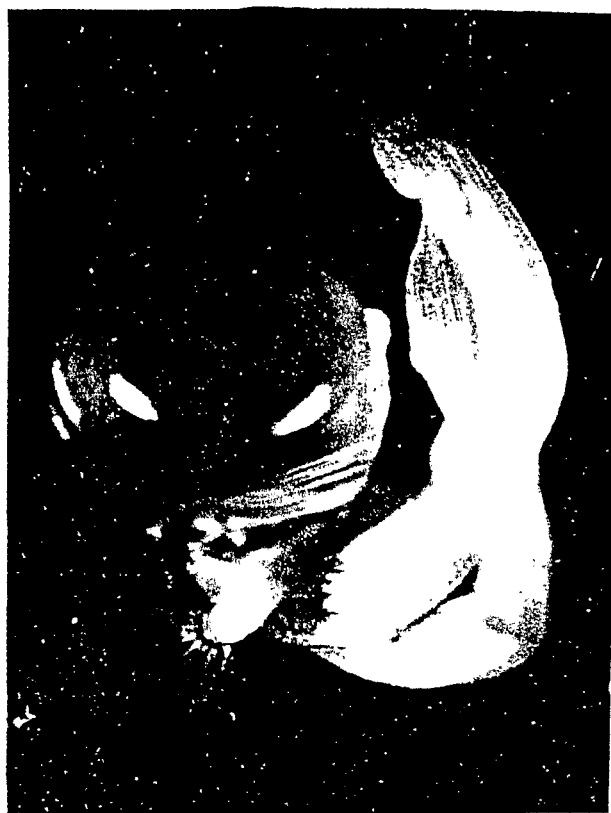
Fig. 2. Apice en regeneración después de la crioconservación.

La figura 2 refleja la regeneración del ápice después de la crioconservación.