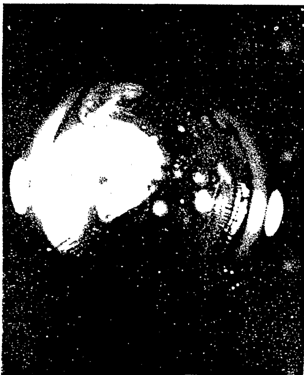
Fig. 1. Apice de una planta in vitro (0.5 mm), encapsulado.

Los métodos de congelación estudiados no tuvieron una influencia marcada en la sobrevivencia del material biológico crioconservado, por lo que la inmersión directa en nitrógeno líquido podría ser una variante más económica y sencilla.