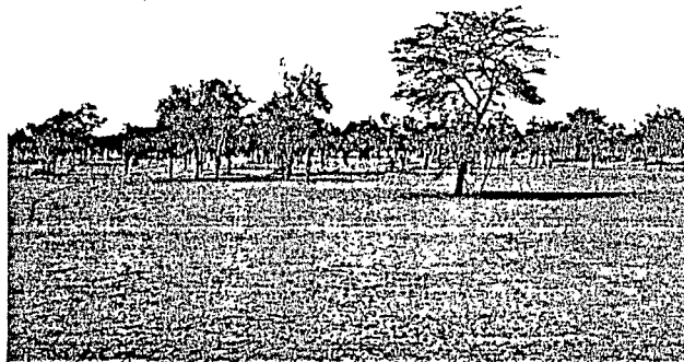
Photo 1 : Steppe arbustive, bosquet de Balanites aegyptiaca (au premier plan, Acacia raddiana ).