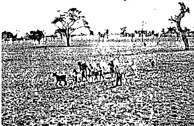
Photo 2 : Saison sèche : disparition de la strate herbacée annuelle.

L'élevage qui est la principale activité des populations de cette région est essentiellement orienté vers l'exploitation des bovins et des petits ruminants. Cependant, dans la présente étude, les bovins n'ont fait l'objet que d'investigations occasionnelles à cause de leur tendance à se déplacer vers le sud à la recherche de meilleurs pâturages. Les recherches portent ainsi uniquement sur les ovins et les caprins qui sont maintenus dans cette zone écologique défavorable, en raison de leur capacité à mieux exploiter les maigres ressources du milieu. Le Touabir et le mouton Peul-Peul sont les races ovines autochtones, mais le produit de leur croisement dénommé Waralé est préféré par les pasteurs qui lui trouvent une plus grande résistance. En ce qui concerne les caprins, il n'existe qu'une seule race, la chèvre du Sahel.