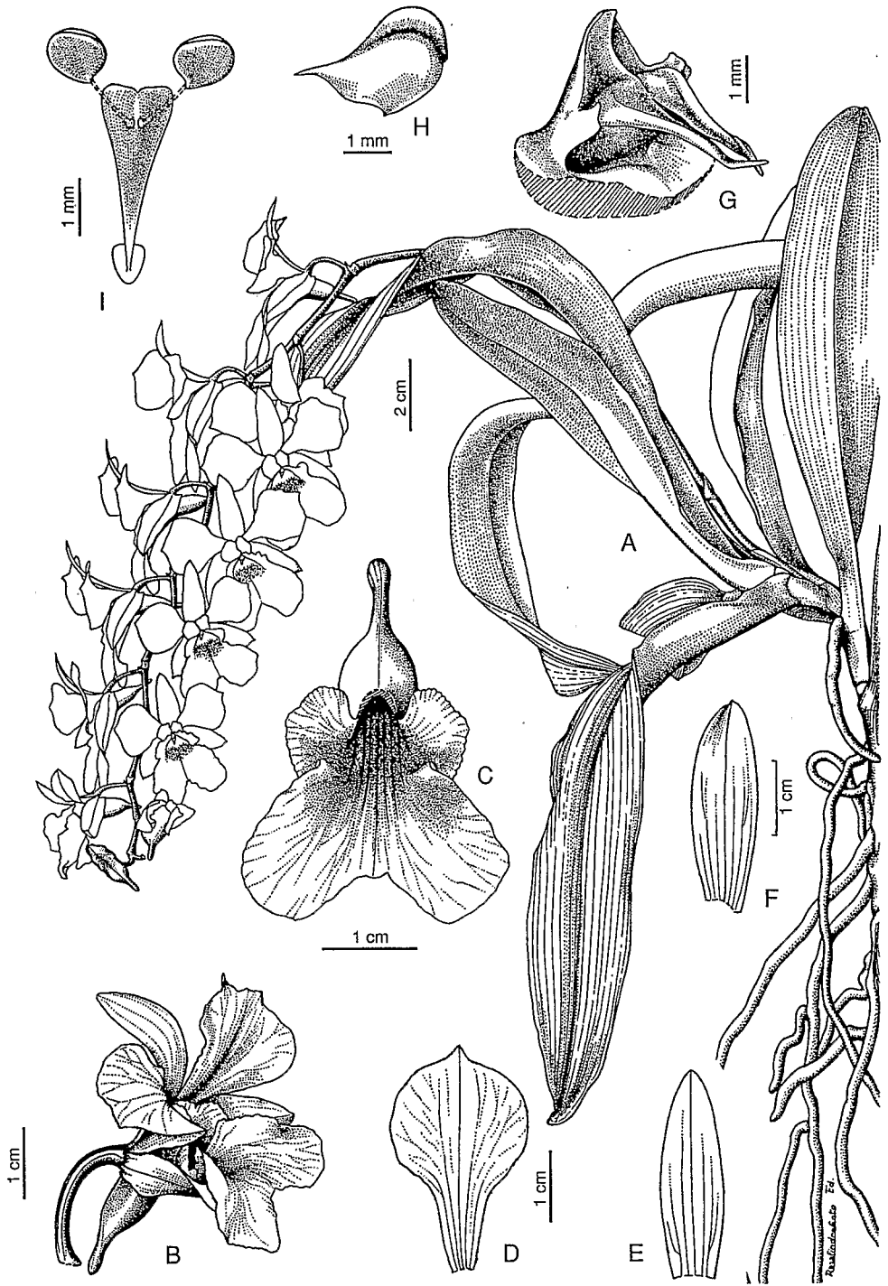
Fig. 3. — Beclardia grandiflora : A, plante fleurie ; B, fleur, profil ; C, labelle, lobes latéraux étalés ; D, pétale ; E, sépale médian ; F, sépale latéral ; G, colonne, vue de trois-quarts ; H, anthère, profil ; I, pollinaire. (A-I, Bosser 17957, P).